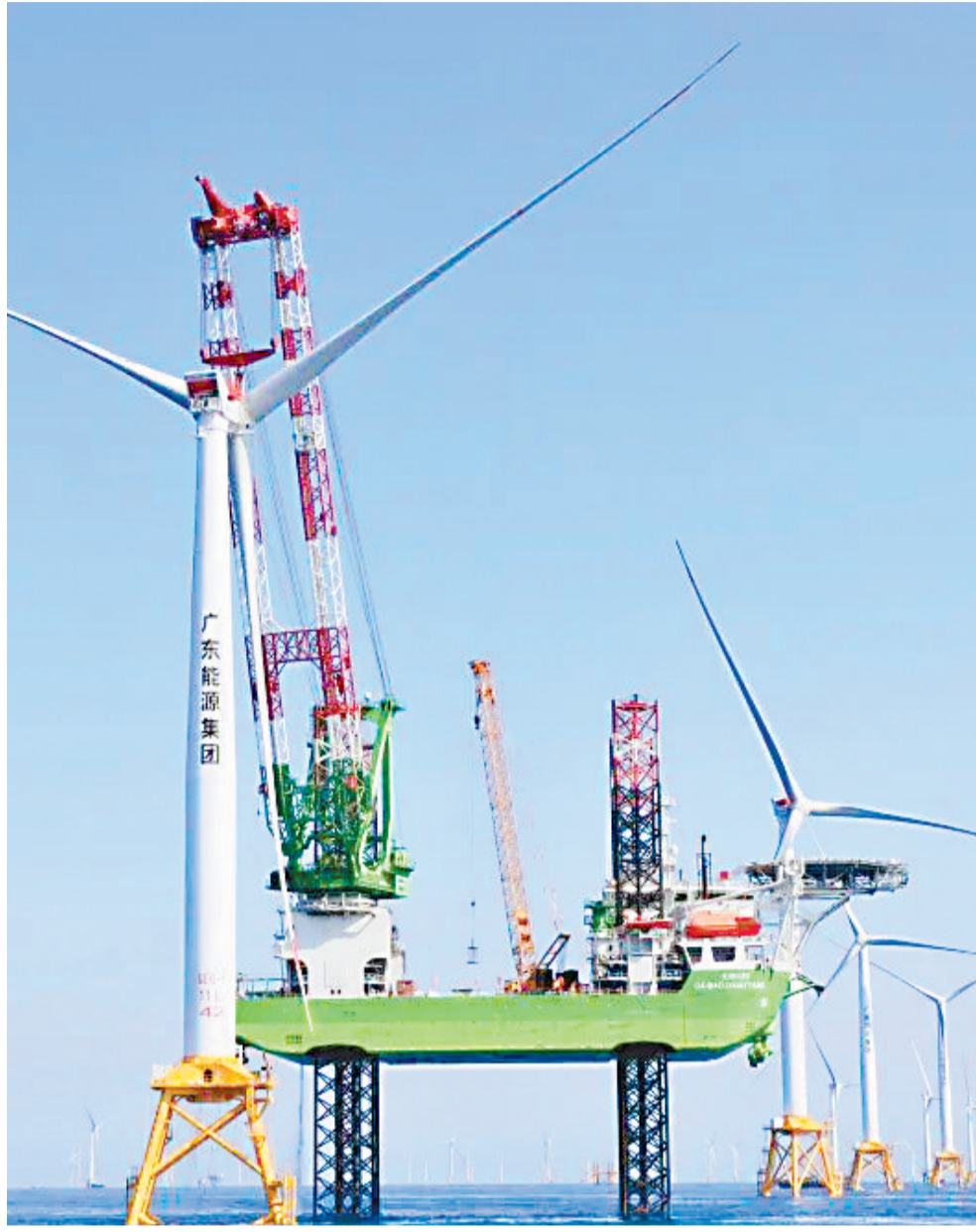
中铁大桥局施工的海上风电项目。

12月6日,中铁大桥局研发的海上风电场数智化施工管控平台正式发布。该系统通过整合船舶调度、人员安全、施工进度、质量追溯及海况监测等管理模块,实现了对全过程生产要素的信息化组织管理,为项目安全高效推进提供支撑。