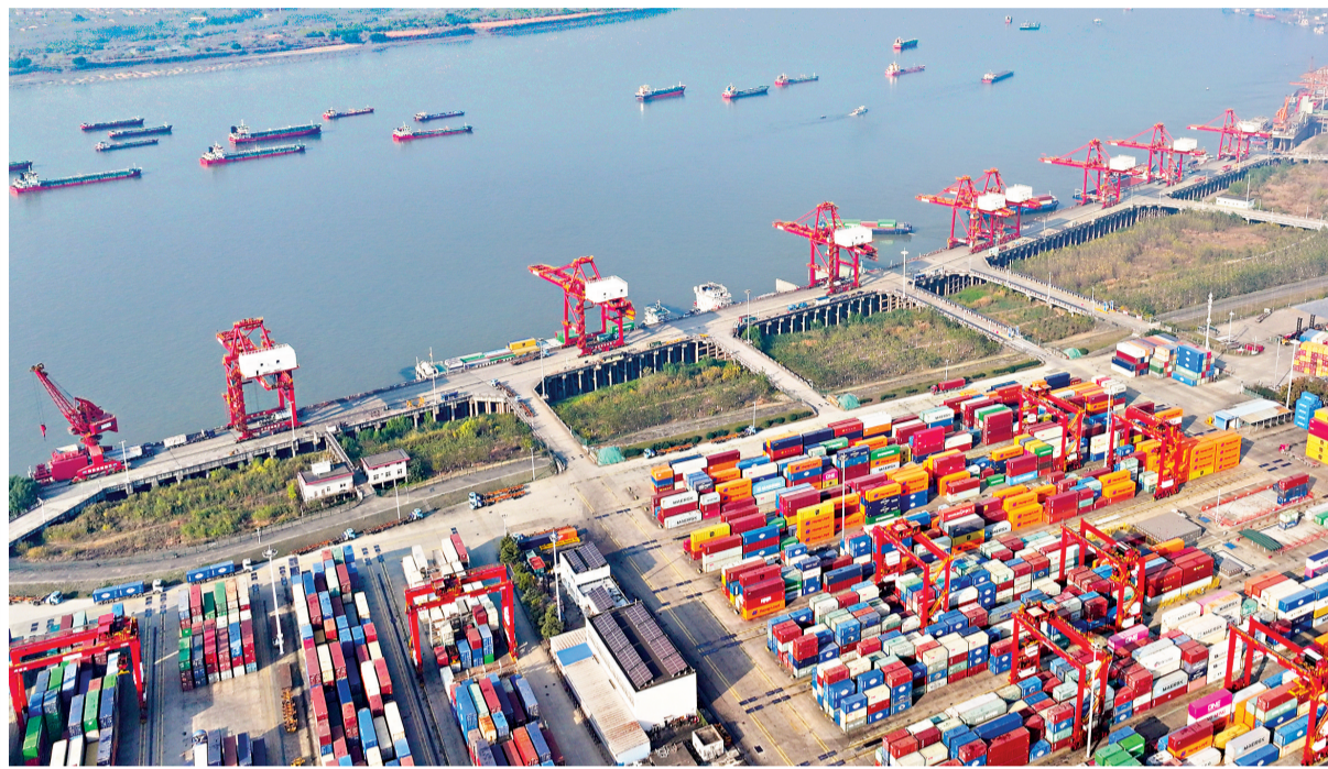
繁忙的阳逻港。