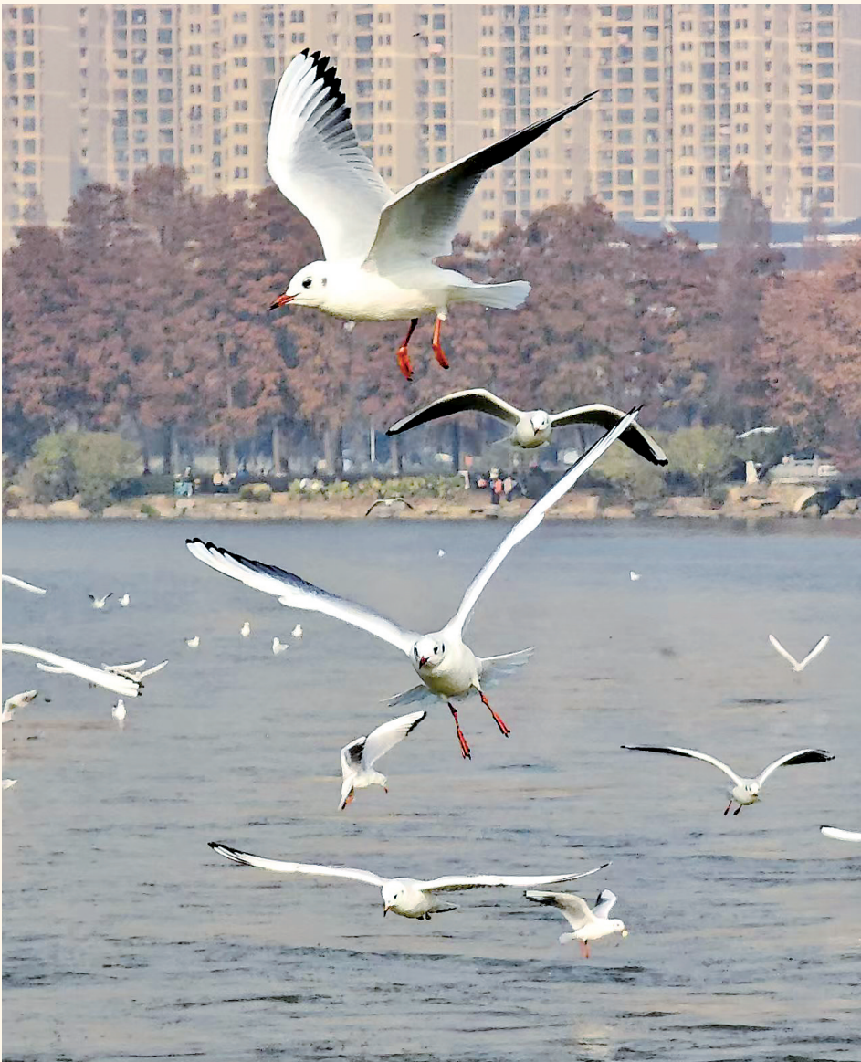
红嘴鸥在东湖翱翔。