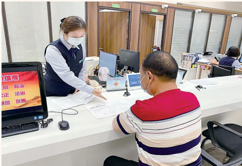
←东西湖区行政审批局窗口,工作人员为办事群众解答问题。