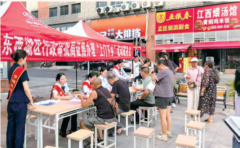
东西湖区行政审批局“上山下乡”服务分队走进产业园区,方便群众和企业就近办理业务。

“多个事项迁移集成为‘一件事’,避免了我们‘往返跑’,这种‘陪跑’式政务服务真是太贴心了。”该公司经办人由衷赞叹。