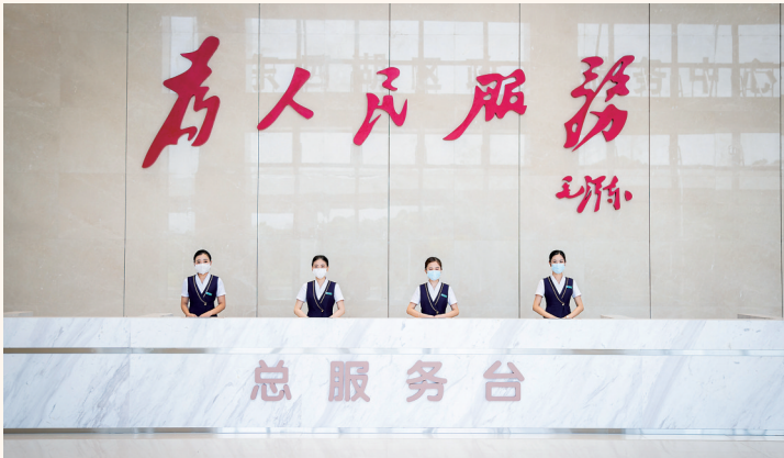
东西湖区行政审批局持续优化营商环境,推动政务服务从“能办”到“好办、易办”的系统性变革。

数字的背后,是一场以“高效办成一件事”为主线,推动政务服务从“能办”到“好办、易办”的系统性变革。