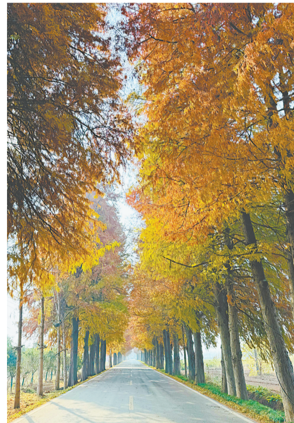
103省道汉阳街道段风景宜人。

据了解,汉阳街道实施“四线一口”环境整治后,开展清垃圾、疏沟渠、硬化田间路等工作,将零散地块整合为标准化农田,还修建了“湘口之心”公园。村民们感叹:“现在的乡村比城里还宜居。”