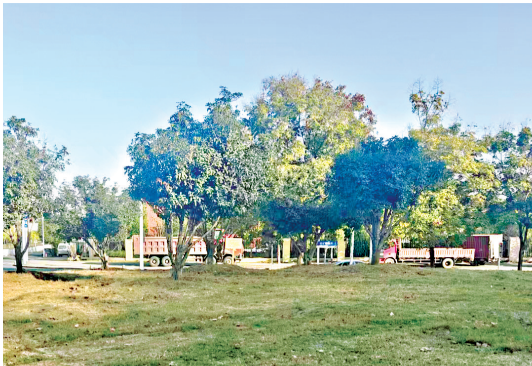
绿化带上的违停车辆已清理。

长江日报讯(记者商佩)洪山区爱家天桥下的草坪,近日悄然变了样——那些曾长期“霸占”绿化带的违停车辆已被清理,困扰市民的停车乱象得以改善。经长江日报记者协调,一套多方协同的长效管理方案随之明确。