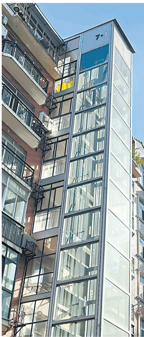
凤凰世纪家园小区加装的电梯。