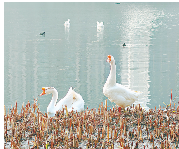
北湖中的白鹅。

“现在早晚温度低,它们在湖里叫得大声,我们听着也心疼。”家住江岸区世纪华庭小区的陈女士说,这几只白鹅平时在湖面嬉戏的模样很受居民喜爱,虽然叫得有点吵,但是大家都不反感,希望给它们安置一个鹅棚。