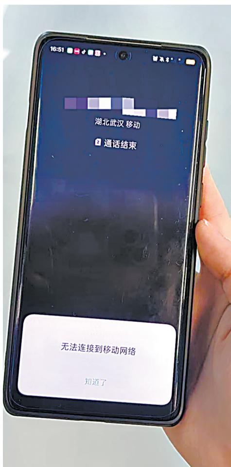
手机在地下车库无信号,无法拨打电话。