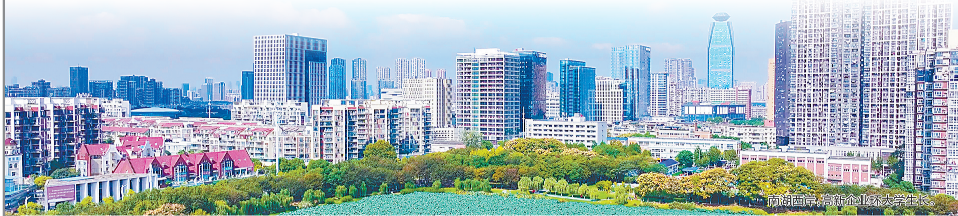
南湖硅巷·高新企业环大学生长。