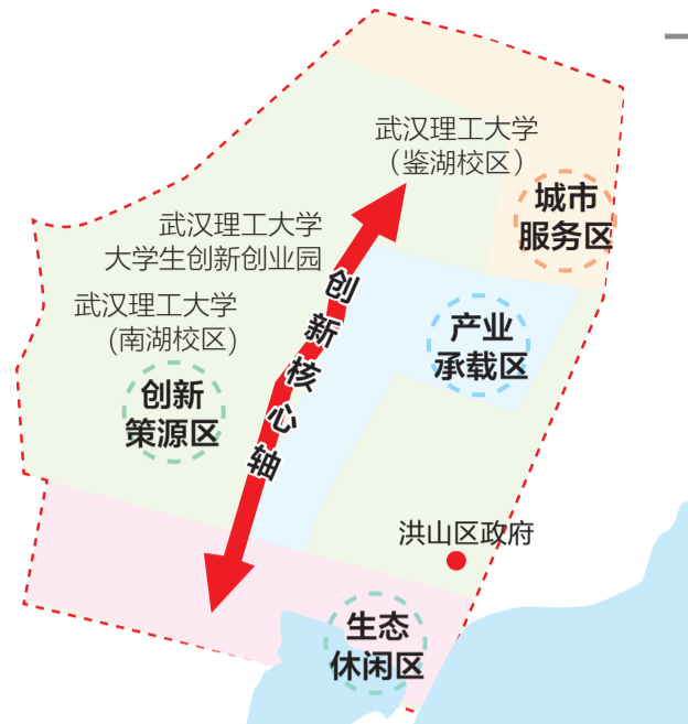
南湖硅巷·环理工大创新街区创新生态示意图。制图 职文胜

“未来在街区里,研究形成技术,技术催生企业,企业聚成产业,产业反哺生态。”洪山区相关负责人表示,南湖硅巷·环理工大创新街区是洪山区以“五改四好”为主攻方向高质量推动城市更新、以城市发展方式转变带动经济发展方式转变的重要实践,将全面赋能城市结构优化、功能完善与品质提升,标志着洪山区环大学创新发展建设步入系统性推进、整体性提升的新阶段。(参与采写:梁嘉雯)