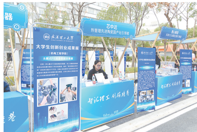
“智汇理工·引领硅巷”大学生创新创业成果展。