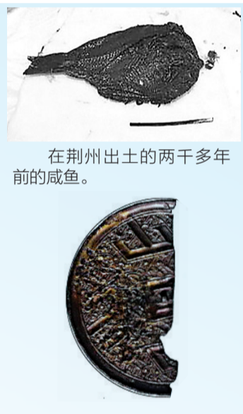
在荆州出土的两千多年前的咸鱼。巴泽雷克墓地出土的楚国山字纹铜镜,仅余半片。