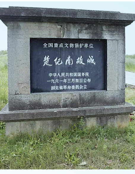
楚纪南城故城。