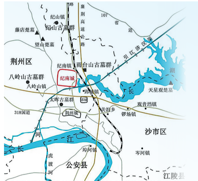
纪南城地理位置图,可见纪南城周边有多个古墓群。

巴泽雷克巨石冢的年代为公元前5世纪—前3世纪,正是楚国国力日盛之时。那条古道上还要过很久很久才会迎来张骞,但文明交流之路从未断绝。