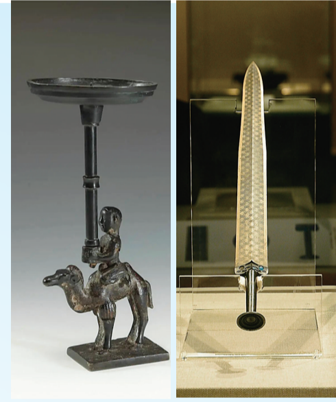
纪南城楚墓出土的“人骑骆驼灯”。越王勾践剑。