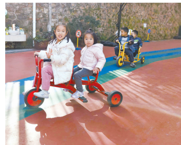
华中师范大学附属幼儿园,混龄班的孩子进行户外活动。