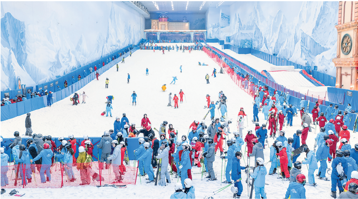
市民和游客在武商梦时代WS热雪奇迹享受滑雪乐趣。