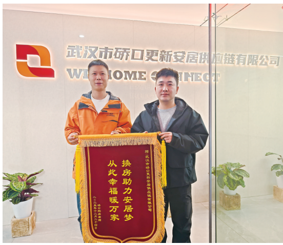
硃口换房居民感谢安居公司。