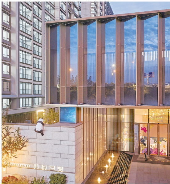
凯德淮海壹号项目实景图。

68岁的李奶奶正带着3岁孙子玩“竹林滑梯”,“以前老房子连个像样的儿童乐园都没有,现在孙子玩得不想回家!”(靖华)