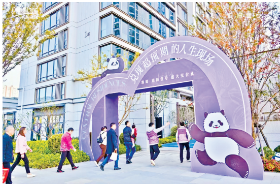
凯德淮海壹号交付现场图。