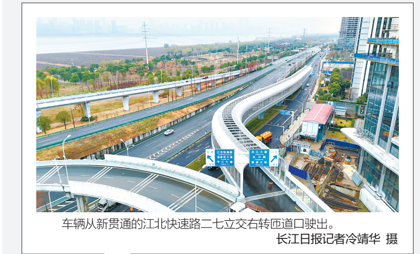
车辆从新贯通的江北快速路二七立交右转匝道驶出。