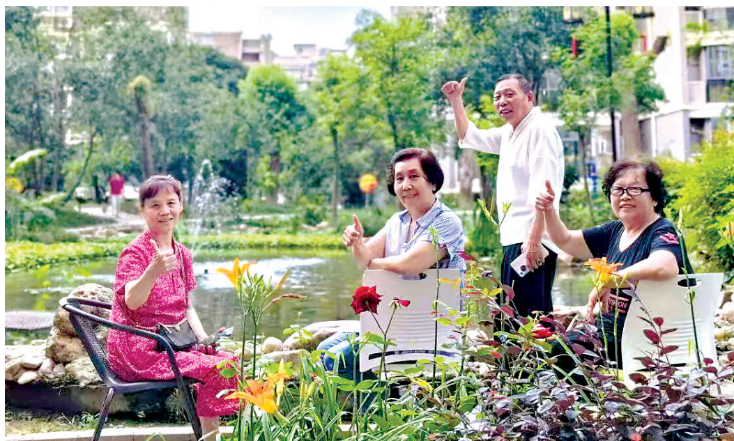
武昌居民愿原正加速转化为幸福图景。

治”一体化，39个小区引入信托制物业，改造公共空间200余处，群众愿聚加速转化为幸福图景。 武昌区始终将千家万户的“心头事”作为执政为民的“头等事”，民生成果更加可感可及。 这一年，武昌区全龄友好服务提升，民生保障网越织越密，覆盖全生命周期，“学在武昌”品牌更亮，新增学位4080个，“健康武昌”深入民心，社区养老服务服务中心医联体全覆盖，242万居民签约家庭医生，“老有颐养”触手可及，新建社区幸福食堂10家，提供“三助一护”超150万人次。“幼有善育”普惠惠及，全区托位数达6910个，青少年爱心托管班实现街道全覆盖，一件件民生实事，共同托举起宜居宜业、近悦远来的“幸福武昌”。