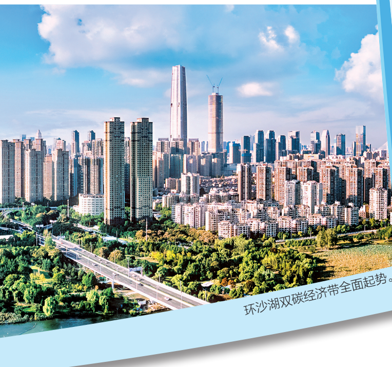
环沙湖双碳经济带全面起势。