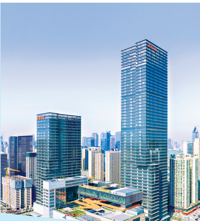
武汉阿里中心提前一年开园投用。