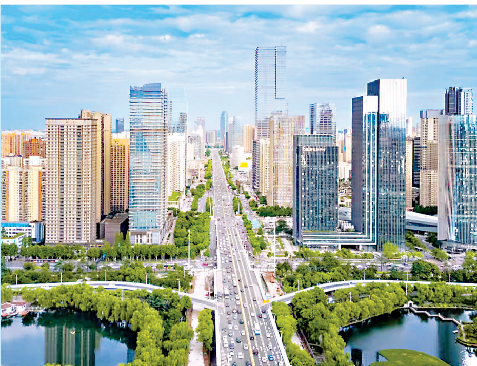
武汉滨江数创走廊纳入全市“一城三廊多带”布局规划。