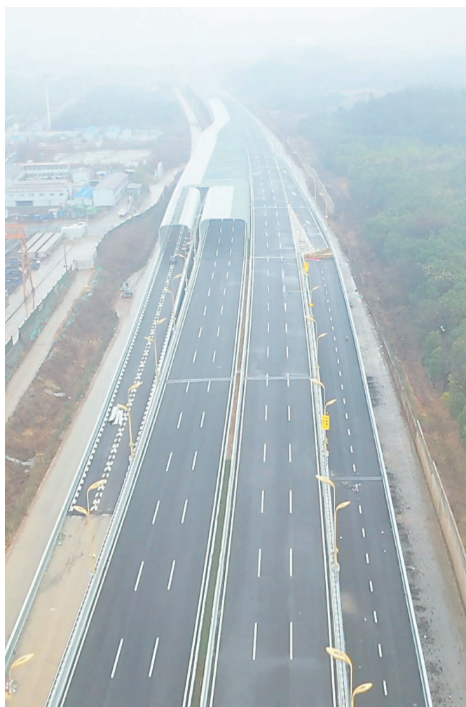
高新三路项目航拍截图。

“打通空中通道只是第一步,让优质生鲜快速到‘餐桌’才是关键。”官海旺说,目前,公司引进的波士顿龙虾、澳洲龙虾、俄罗斯帝王蟹、新西兰黑金鲍高品质海产,已通过空地联运、空铁联运等多式联运网络,迅速分拨至上海、南京、厦门、成都、长沙等国内主要消费城市,并已成功进入“盒马鲜生”等新零售渠道,“价格更实惠了,老百姓‘菜篮子’也更丰富了”。