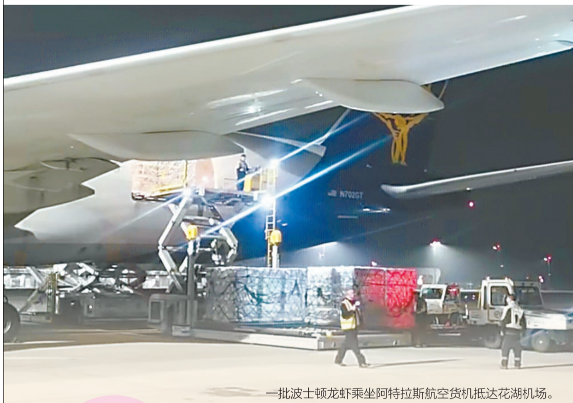
一批波士顿龙虾乘坐阿特拉斯航空货机抵达花湖机场。