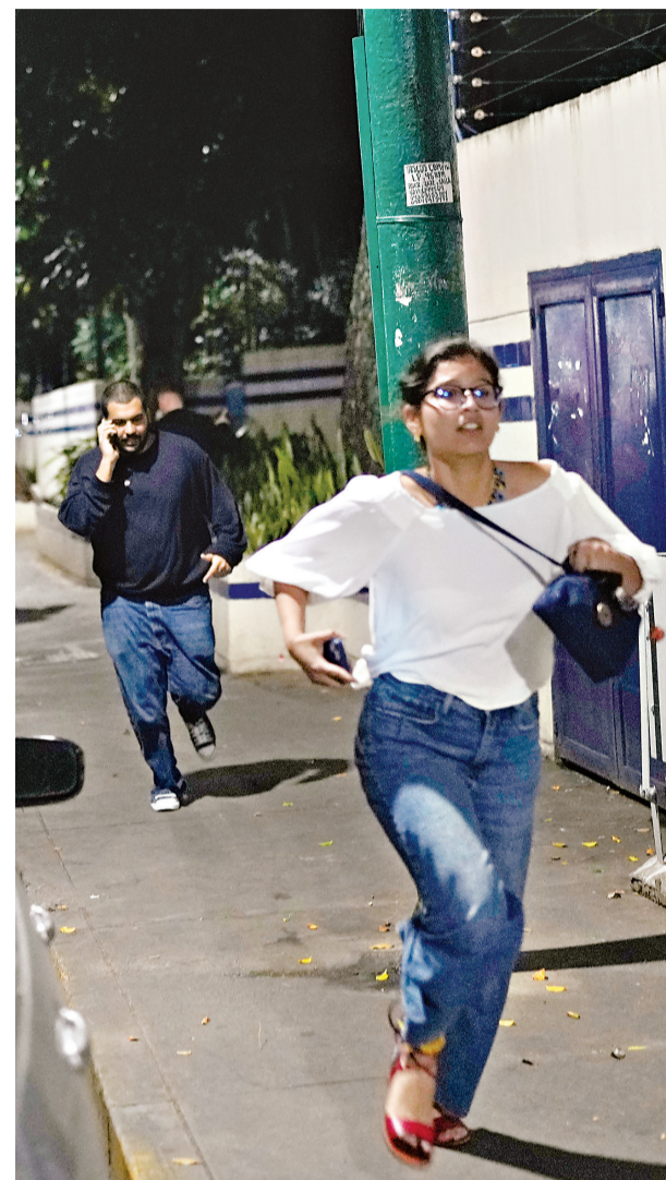
1月3日,在委内瑞拉首都加拉加斯,人们听到爆炸声后在街道上奔跑。

美国多名国会议员也反对或质疑特朗普政府对委发动军事打击。美国国会参议院外交关系委员会民主党成员布赖恩·沙茨在社交媒体上说,美国“没有任何重要国家利益”可以作为在委内瑞拉发动战争的借口,“我们早该学会别再陷入愚蠢的冒险了”。