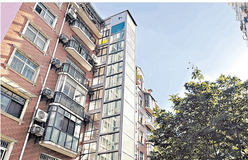
凤凰世纪家园小区加装的电梯。