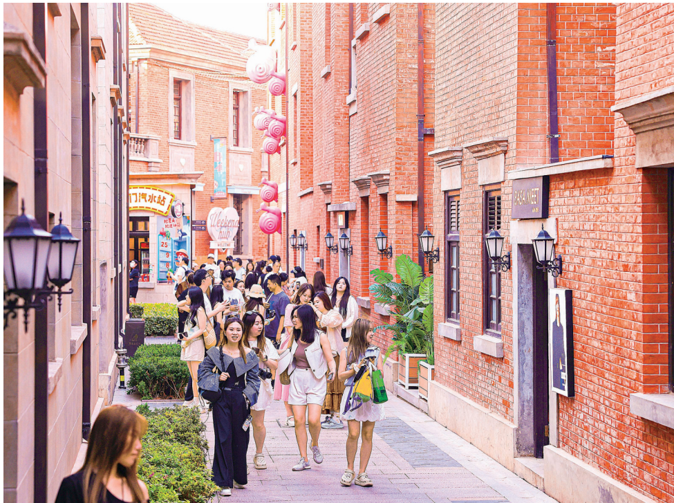
百年威安坊吸引众多年轻人前来游玩。