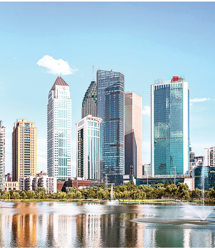
“直商江汉”服务品牌让江汉“国际范”越来越浓。