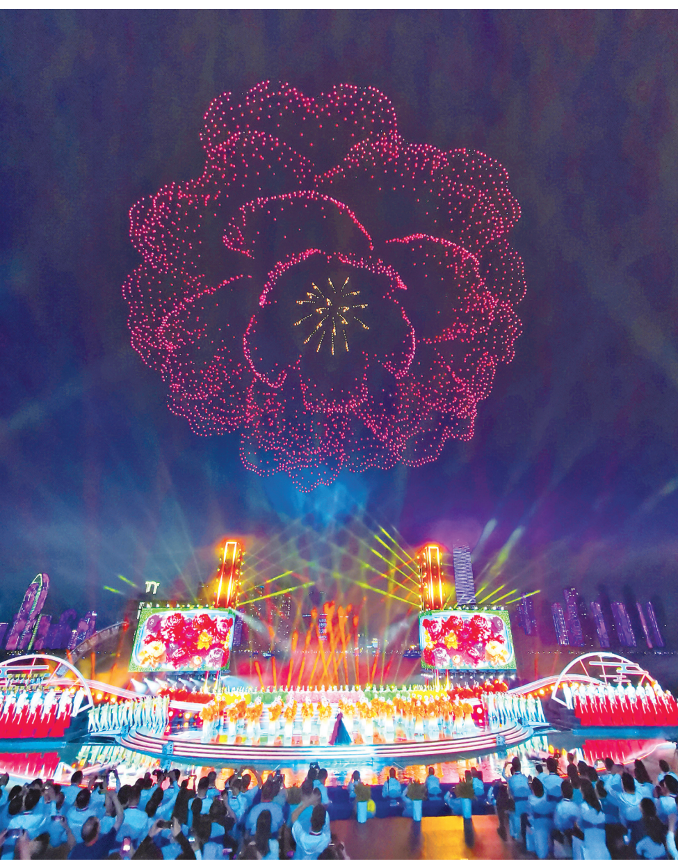
2025年9月12日晚，2025长江文化艺术季开幕式在汉口江滩三阳广场及长江水域举行，融文艺演出、绚烂烟花、灯光秀、无人机编队表演于一体。