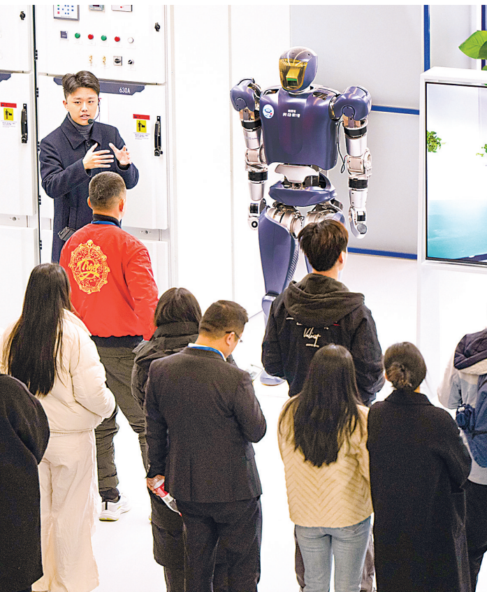
位于光谷的湖北人形机器人创新中心，已建成全国规模最大、场景最丰富的人形机器人专业训练平台。