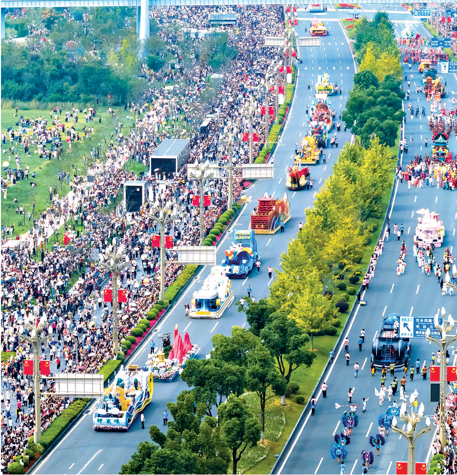
2025“河山添锦绣——文脉IP武汉城市大巡游”吸引近10万市民游客现场观看。