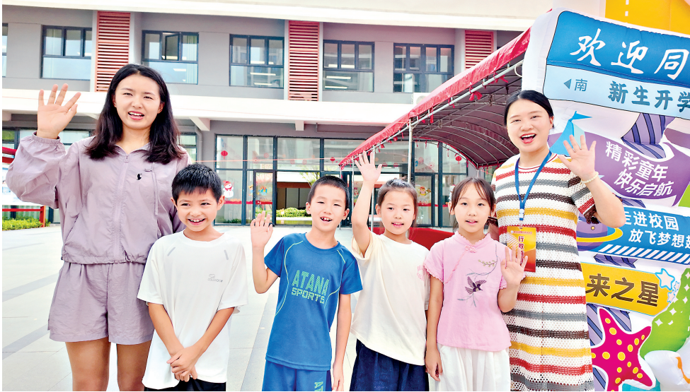
2025年，武汉多了10所“家门口的学校”。2025年8月31日，武汉育才小学甘露分校学生报到，师生们迎来新学期。