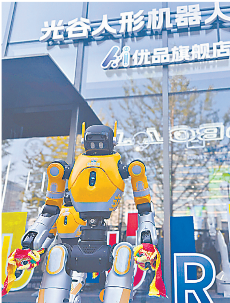
2025年11月11日，全国首家人形机器人7S店在光谷创新天地商业公园开业。