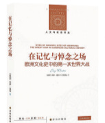
摘编自《在记忆与悼念之场:欧洲文化史中的第一次世界大战》导论。

本真——音乐在不得不淡化技术后,考验的是本真。这可能是音乐在某个阶段丢失的东西,这大概也是《小孩与我》有意无意间找回的东西。说回来,还有一种回顾,一种生命感的有温度的回顾。它未必是那么高级,但也显得珍贵。“我与我周旋久,宁作我。”令人叹息的是,或者正是AI的突进,才迫使我们的音乐,走向内心。