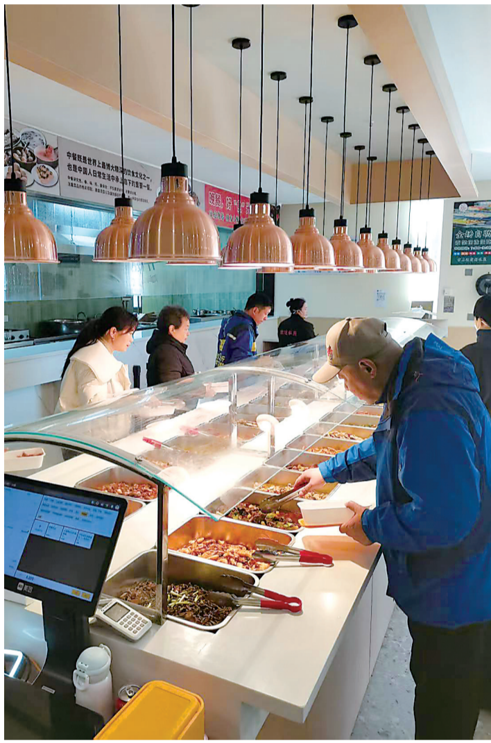
顾客在“就这餐厅”挑选菜肴。

定曹丽说：“这家餐厅既解决了入驻企业员工的吃饭问题，也满足了社区居民的需求，还给少量社区居民提供了就业岗位。”刘俊德透露，后期将开通线上点餐和免费送餐服务，以帮助更多有需要的人。