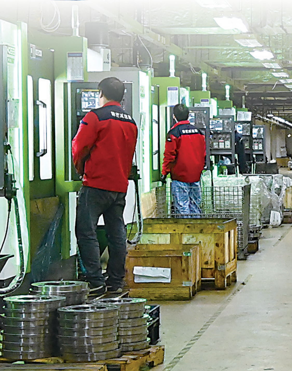
湖北斯微特传动有限公司生产车间内一派繁忙。