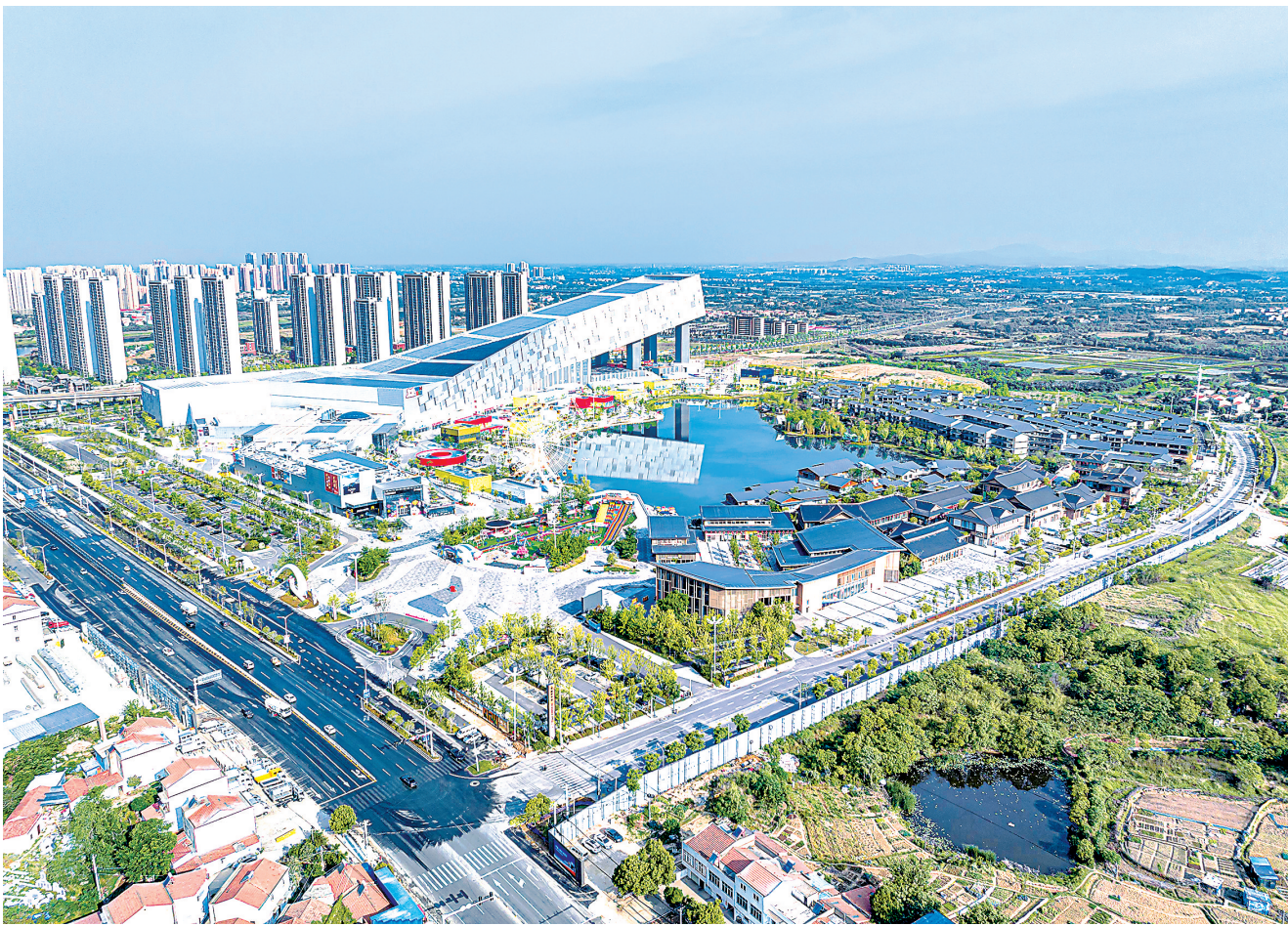
武汉甘露山文创城鸟瞰图。