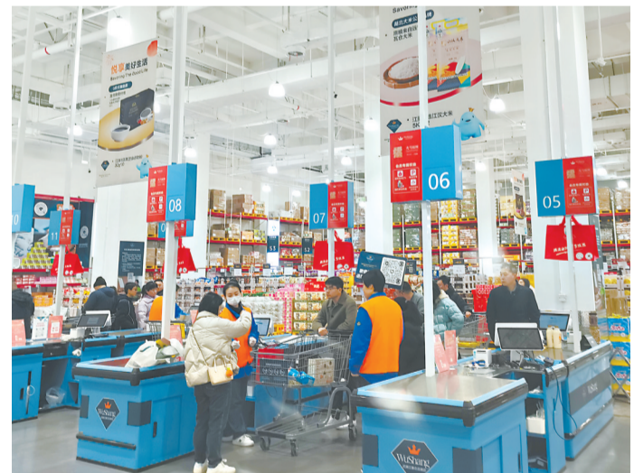
武商江豚会员店卖场。