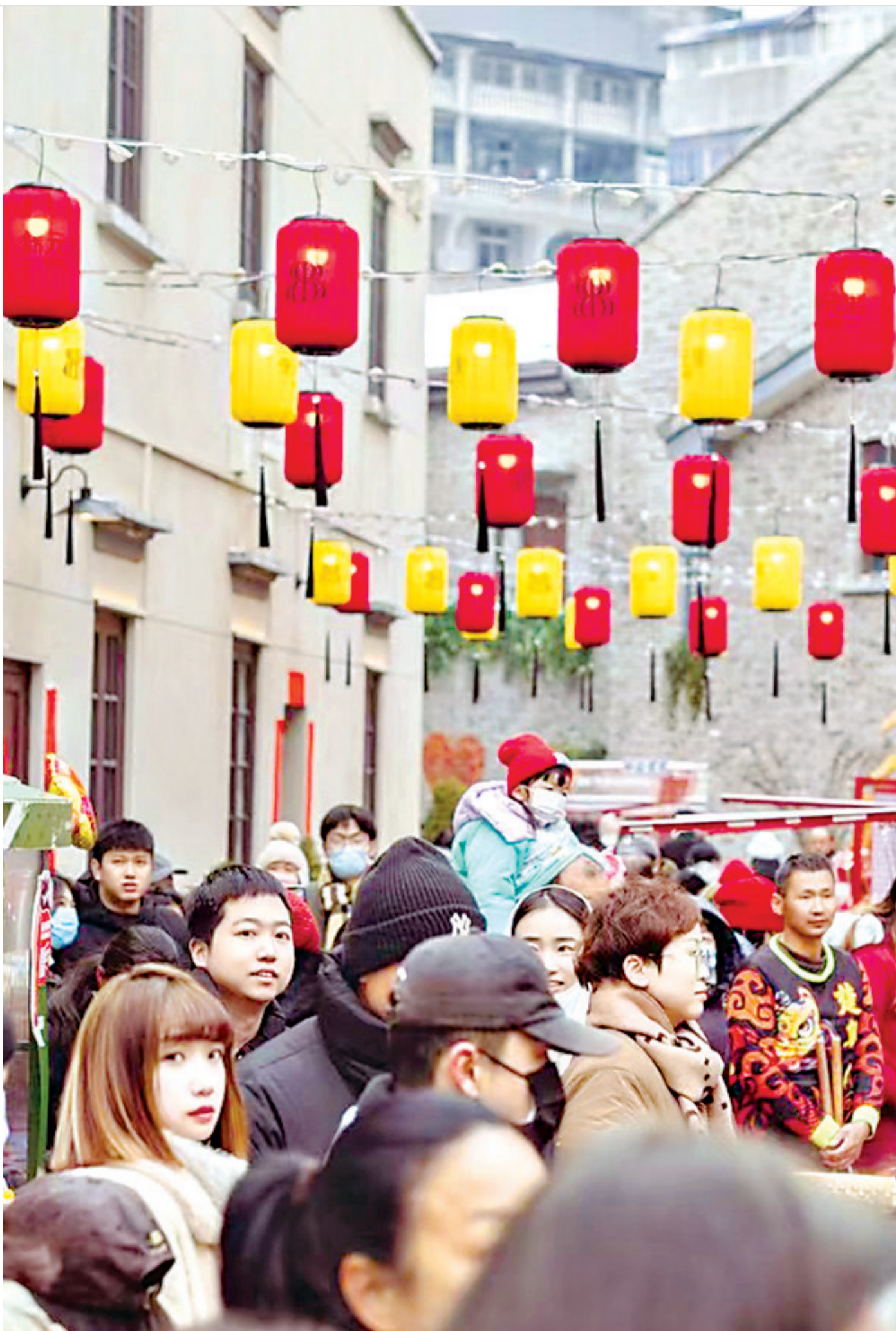
汉口历史风貌区保元里人流如织。