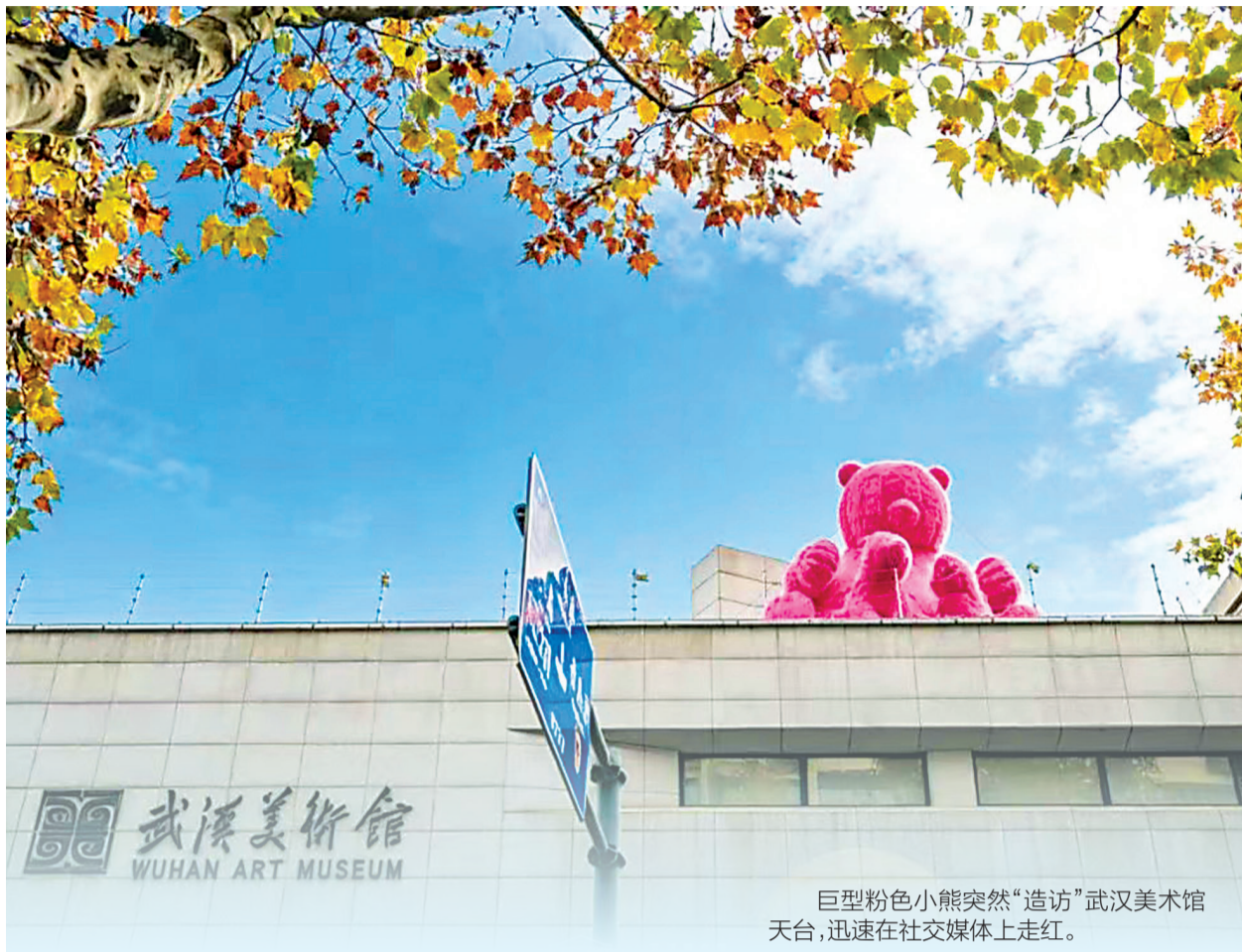
巨型粉色小熊突然“造访”武汉美术馆天台,迅速在社交媒体上走红。

武汉市自然资源和城乡建设局相关负责人表示,《意见》以一系列创新举措,呼应了国家推动“好房子”建设的导向,也贴合市民对住上高品质“好房子”的需求。