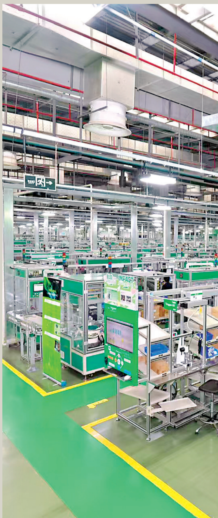
高度智能化的施耐德电气武汉工厂。