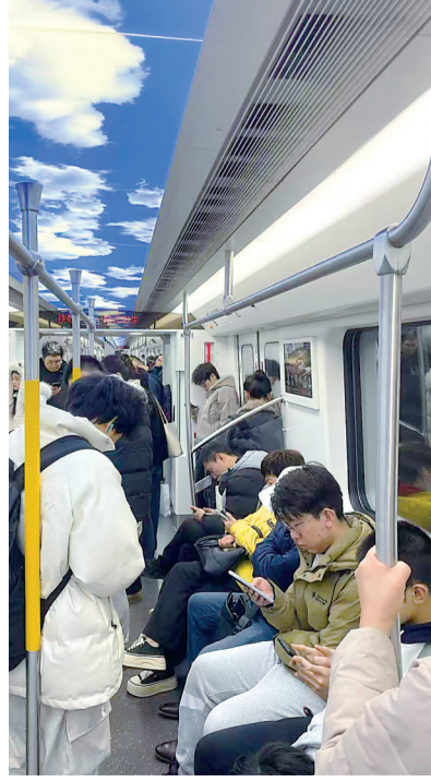
乘坐地铁11号线前往葛店的乘客。