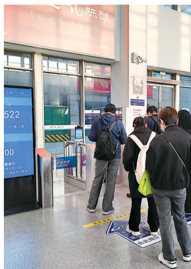
乘客排队乘坐新城快线。