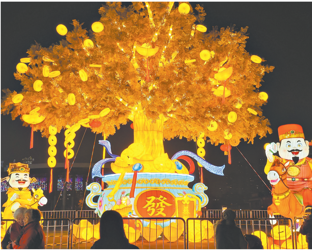
1月28日下午5时40分，武汉园博园所有花灯齐点亮，市民在高达12米的“发财树”前打卡留影。

武汉房地产业内专家分析指出，政策上，武汉各类补贴和优惠降低了购房门槛和成本；价格方面，相比一线城市，武汉房价更具性价比；配套上，交通、教育、医疗等不断完善，提升了城市吸引力。返乡置业热潮正是武汉吸引人才回流的真实写照。