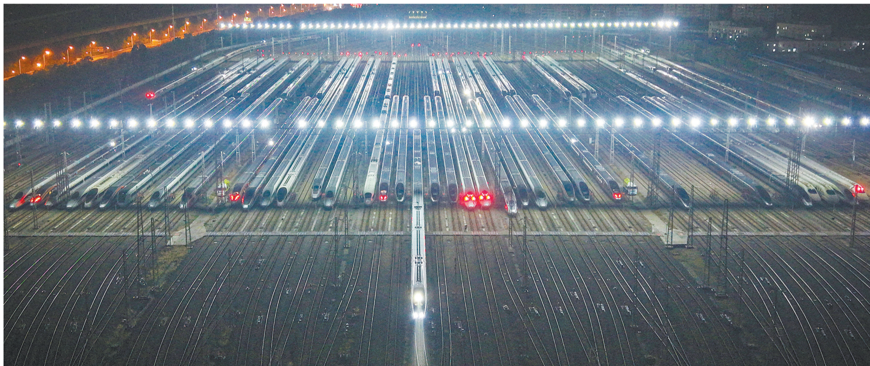
2月1日凌晨,武汉动车段灯火通明,近百列高铁动车组蓄势待发。