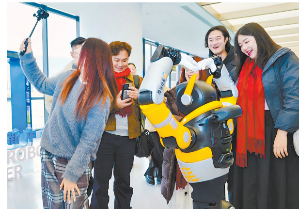
1月31日,在湖北省人形机器人创新中心,海外旅行达人与“武汉造”人形机器人互动。