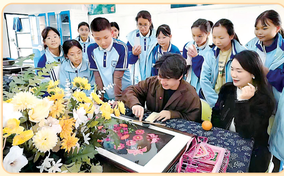
清华大学乡村振兴工作站赴四川省攀枝花市盐边县实践队在长江网“长江头条”平台发布社会实践报告。