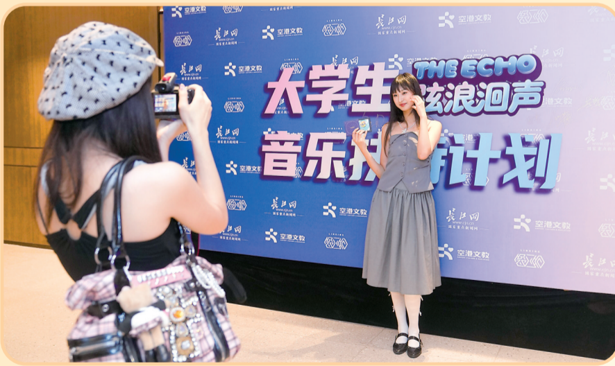
“弦浪回声”湖北·武汉大学生音乐扶持计划吸引30余所在汉高校的500余名大学生报名参赛。