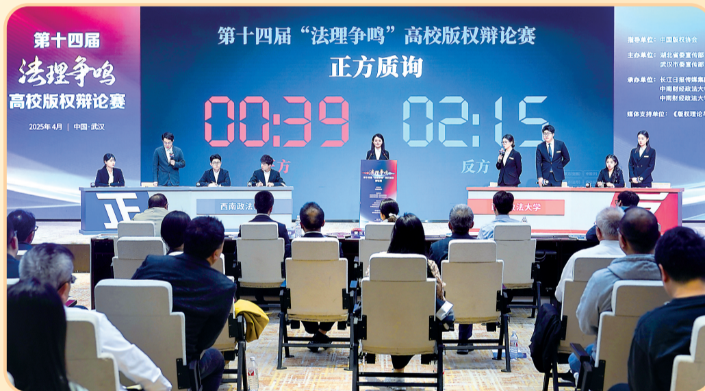
第十四届“法理争鸣”高校版权辩论赛决赛现场。