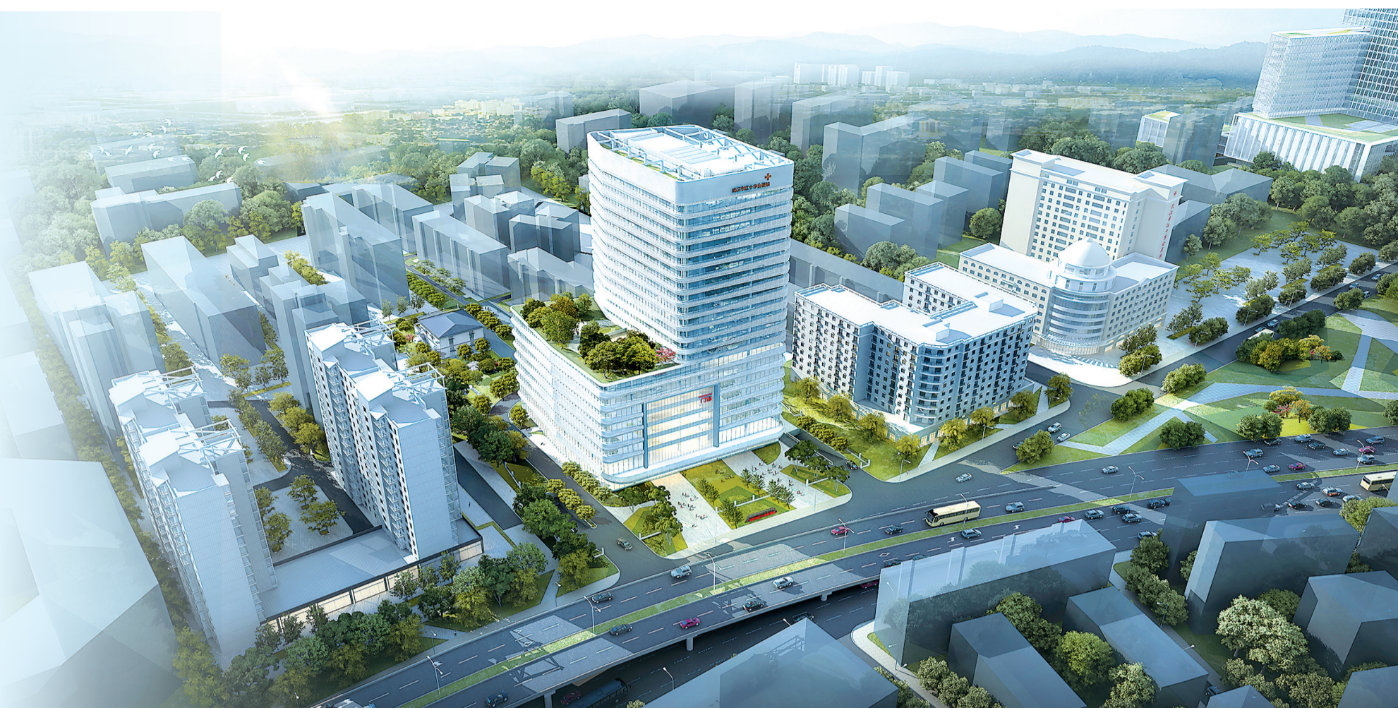
武汉市红十字会医院(北区)。

2月1日,武汉市红十字会医院(北区)正式启用。这座扎根江汉、传承百年的现代化综合医院,始终与时代同频、与健康共进,如今形成“一院两区、同步运行、资源共享、服务协同”的全新格局。