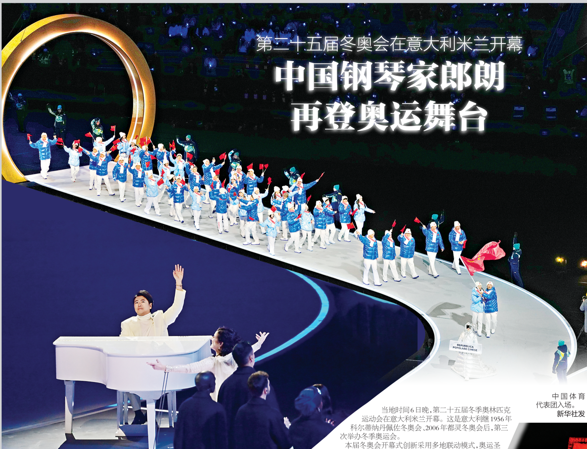
中国体育代表团入场。

当地时间6日晚,第二十五届冬季奥林匹克运动会在意大利米兰开幕。这是意大利继1956年科尔蒂纳丹佩佐冬奥会、2006年都灵冬奥会后,第三次举办冬季奥运会。