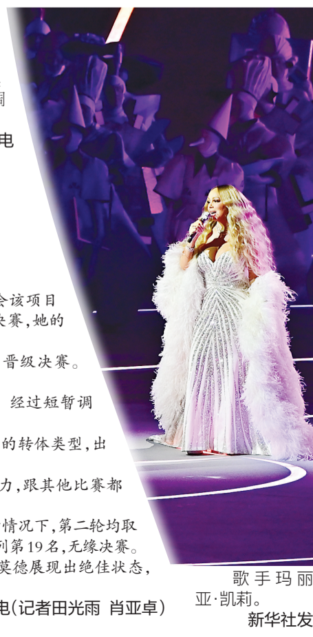
歌手玛丽亚·凯莉。