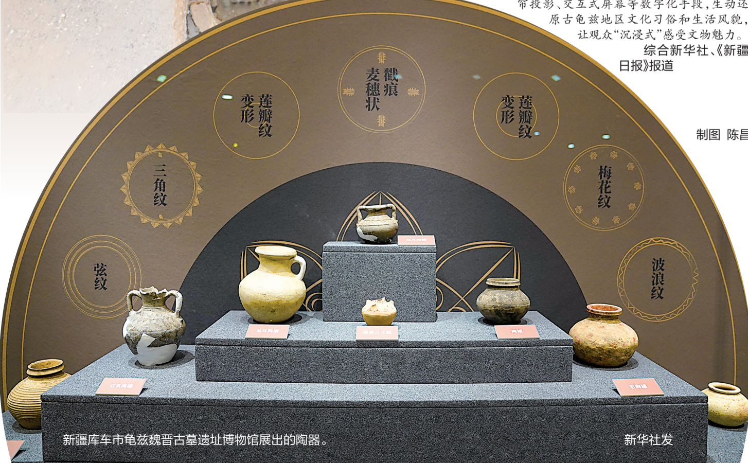
新疆库车市龟兹魏晋古墓遗址博物馆展出的陶器。