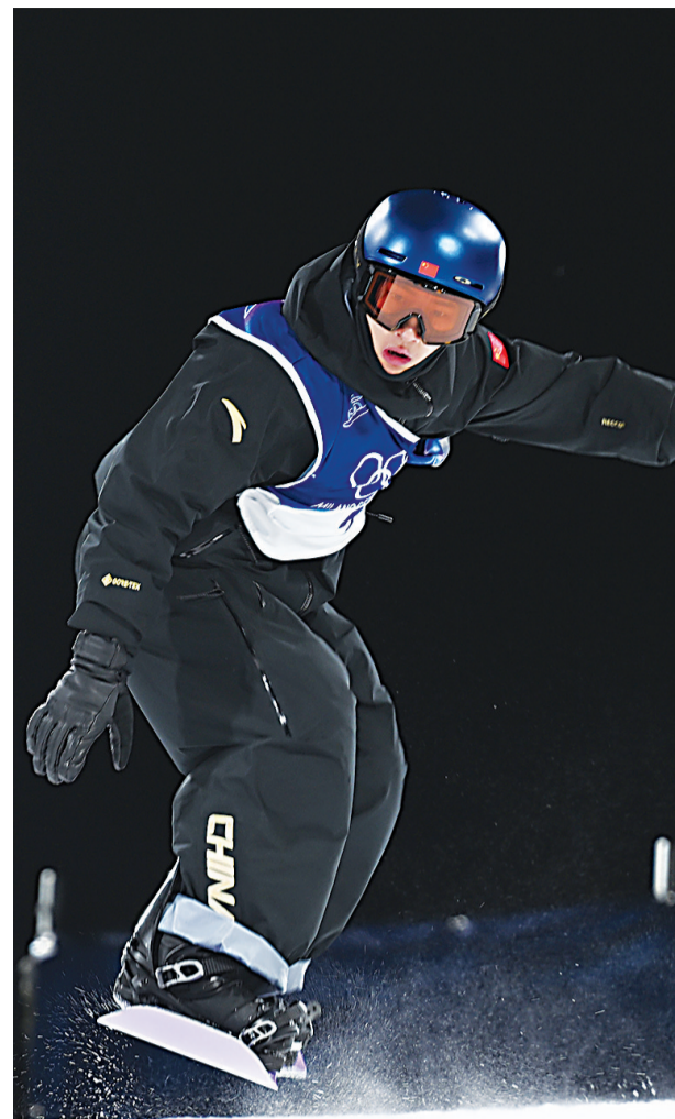
集齐三个颜色的奥运奖牌