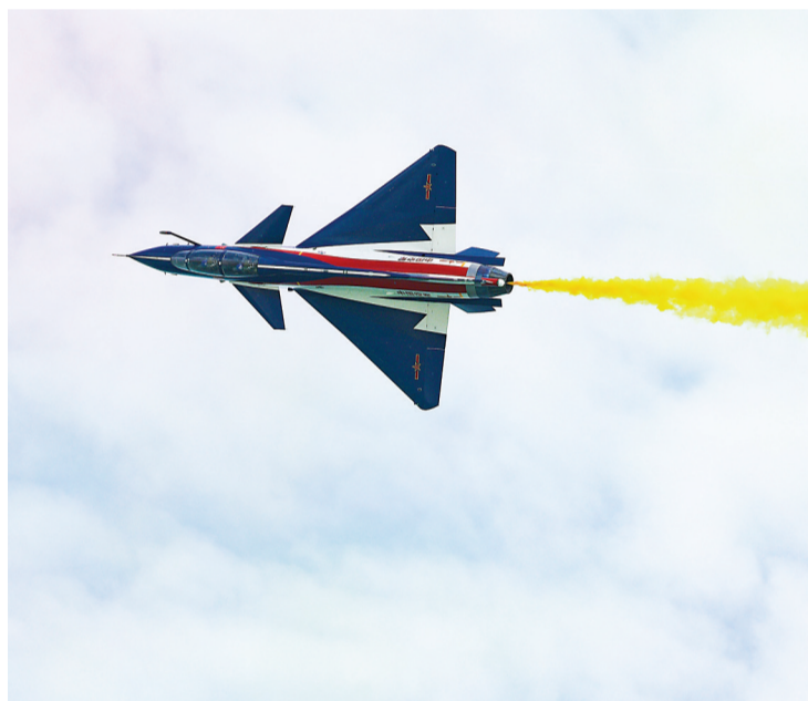
中国空军八一飞行表演队在第十届新加坡航展上进行飞行表演。