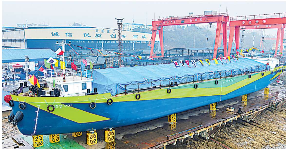
甲醇动力新能源船舶“淮河001”号。