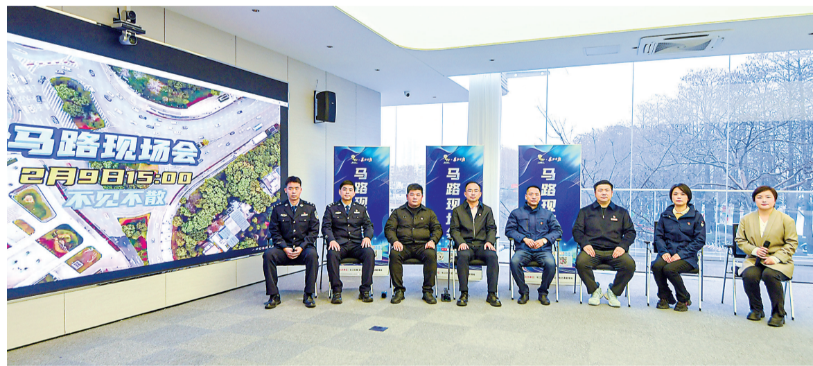
9日武汉飘起雪花,因天气原因改到室内举办的马路现场会邀请多方解析梨园广场及周边交通组织调整。长江日报记者史伟 摄

马戎谈到,这次交通体系的优化提升绝不是简单的“修修补补”,而是立足长远、直面痛点的“城市更新”的一环,相信改造后的东湖游客体验将显著提升,片区活力将有效激发,区域综合治理能力也将全面增强。