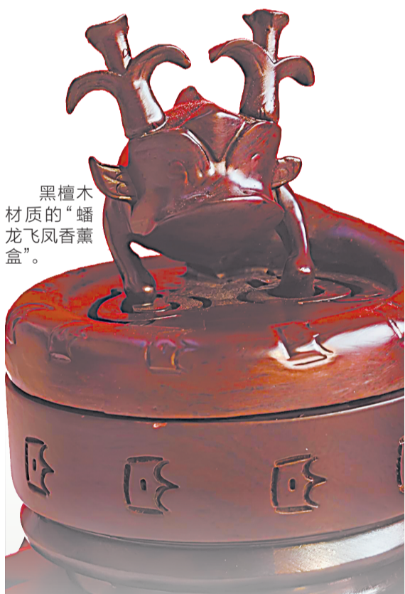
黑檀木材质的“蟠龙飞凤香薰盒”。