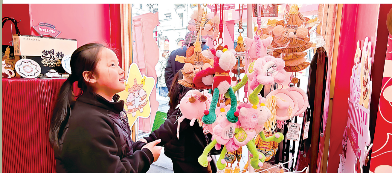
小朋友在“楚国礼物”快闪店选购文创产品。