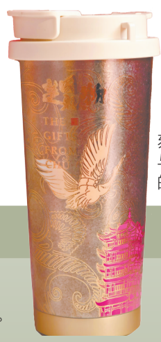
杯身镌刻楚风云纹与飞鹤元素的纯钛杯子。