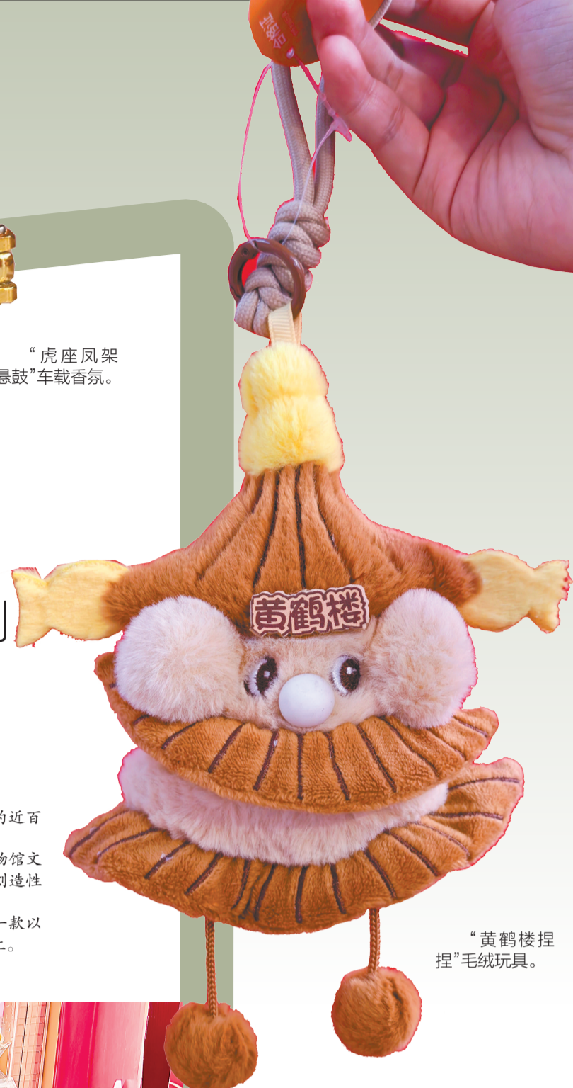
“黄鹤楼捏捏”毛绒玩具。

一款名为“蟠龙飞凤香薰盒”的文创,原型是湖北省博物馆的藏品“蟠龙盖兽面纹铜罍”;一款以黄鹤楼外形制作的捏捏毛绒玩具,造型可爱,因价格不高,不少年轻人会随手买上一件挂在包上。这家快闪店也是“楚国礼物”带着文创产品走出博物馆、走进商圈的尝试之一。