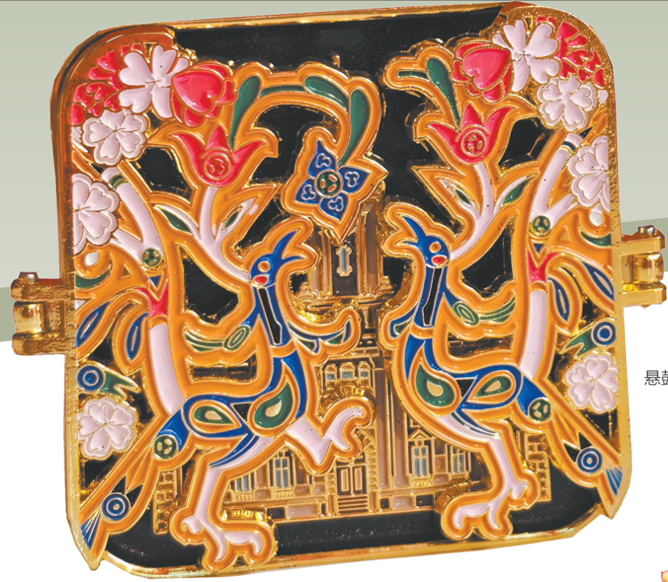
“虎座凤架悬鼓”车载香氛。