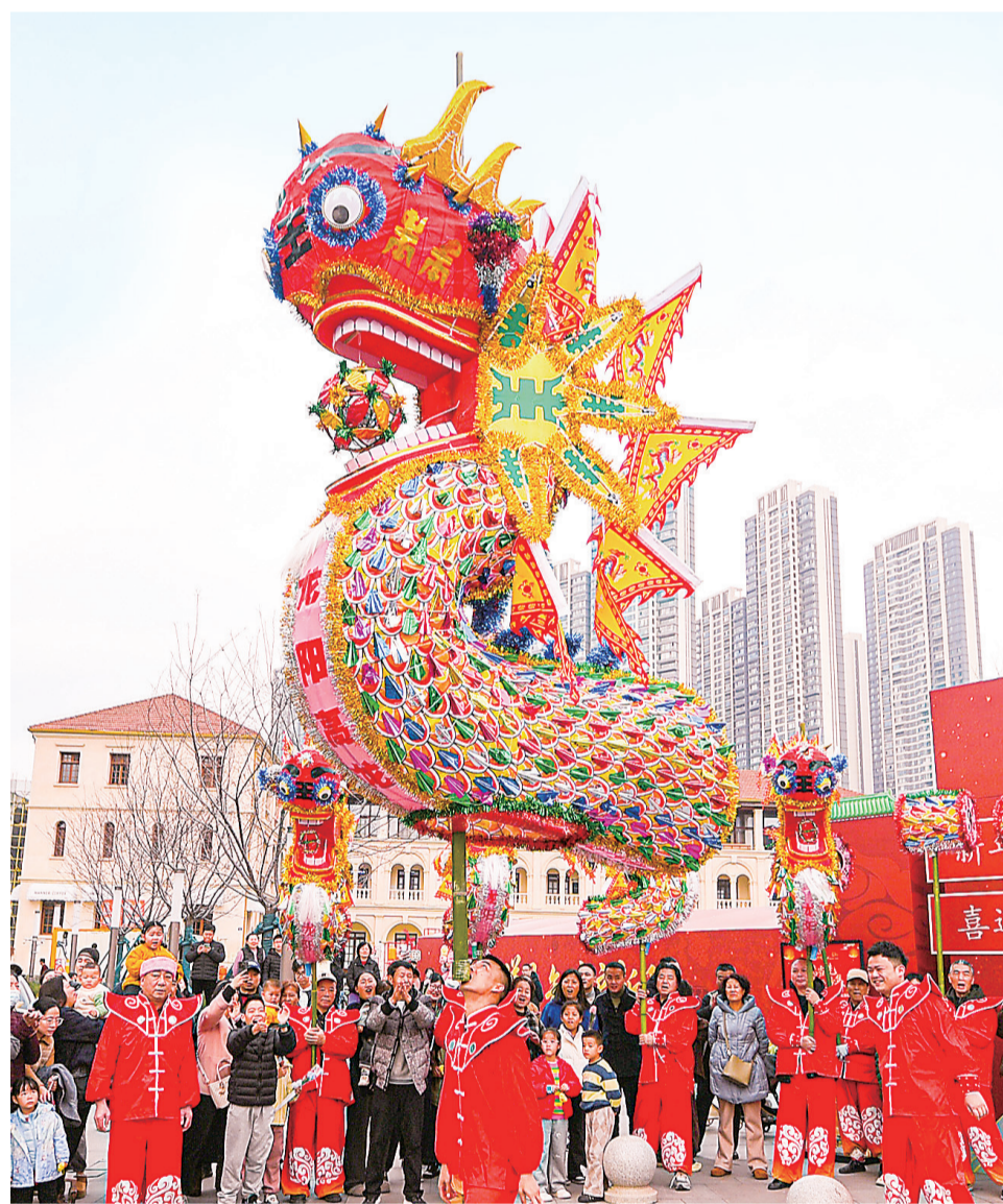
2月15日，汉阳区远洋里非遗民俗表演精彩纷呈，吸引众多市民游客驻足观赏。

午后，天空飘起雨，在汉口历史风貌区，随处可见撑着雨伞漫步的游客身影。不少拖着行李箱的游客直接走进江汉路、黎黄陂路沿线的特色酒店办理入住，开启江城之旅。