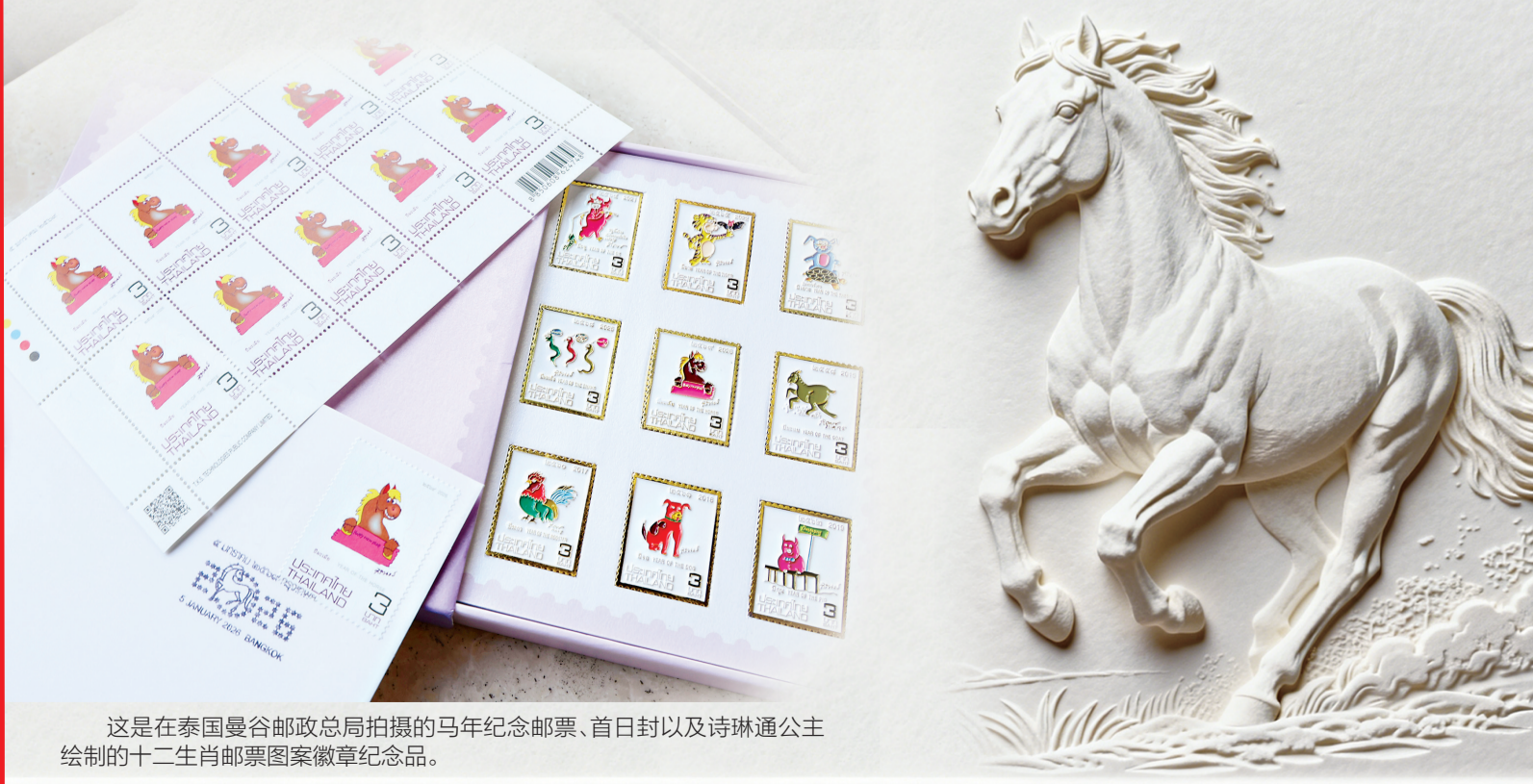
这是在泰国曼谷邮政总局拍摄的马年纪念邮票、首日封以及诗琳通公主绘制的十二生肖邮票图案徽章纪念品。