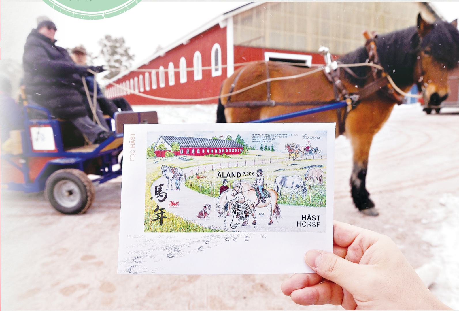
这是在芬兰奥兰群岛自治区首府玛丽港市附近一处马场拍摄的马年生肖主题邮票。