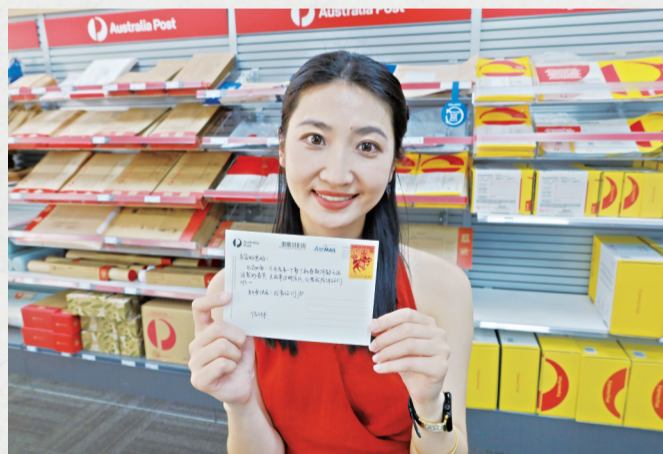
在澳大利亚堪培拉,新华社记者手举写给远方父母的明信片,上面贴有马年邮票。