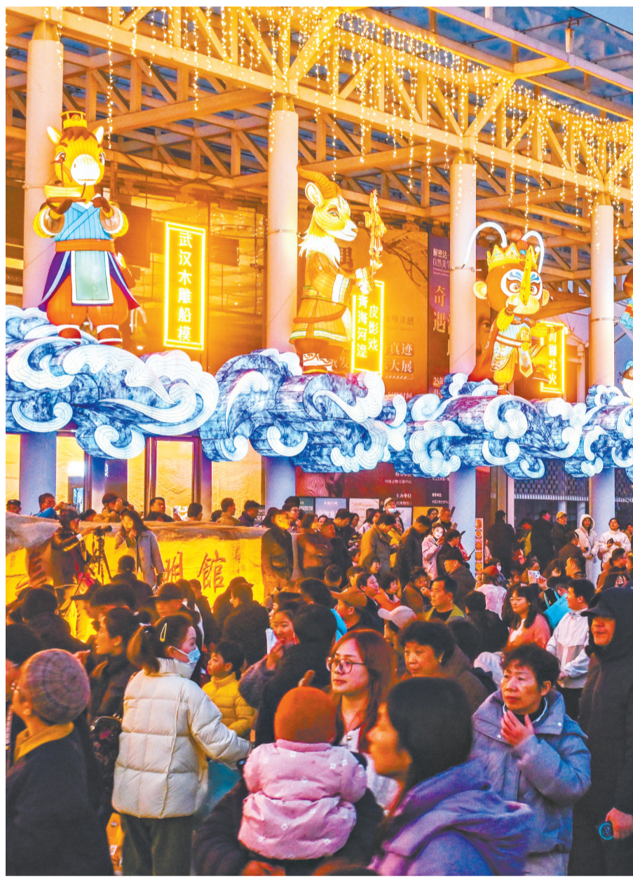
武汉园博园花灯会近70组花灯流光溢彩，勾勒出喜庆祥和的新春图景。

当春节碰上晴好天气，花博汇迎来客流高峰。2月17日到19日，3日累计接待游客4万余人次。漫步花博汇，早春花海美成画卷，6万株郁金香迎来最佳观赏期，搭配七彩角堇、雏菊等时令花卉，织就绚烂的“大地调色盘”。下午6时，花博汇非遗