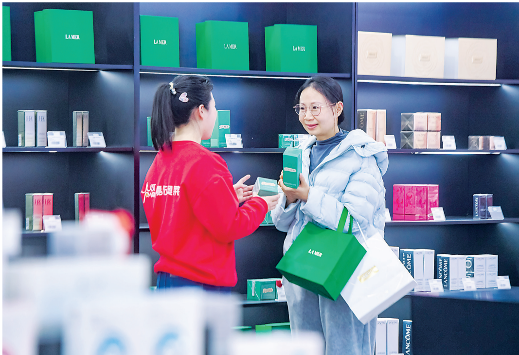
游客在甘露山嘉佑城市奥莱国际美妆集合馆选购商品。