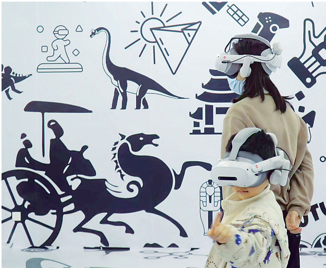
游客在武汉万象城未来视界XR沉浸式探索中心体验虚拟现实电影。