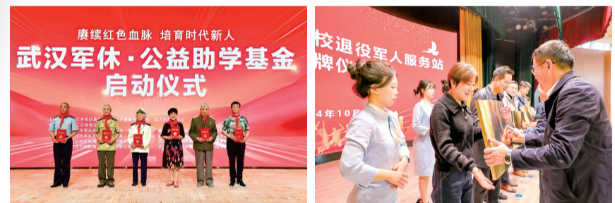
武汉军休·公益助学基金正式启动。