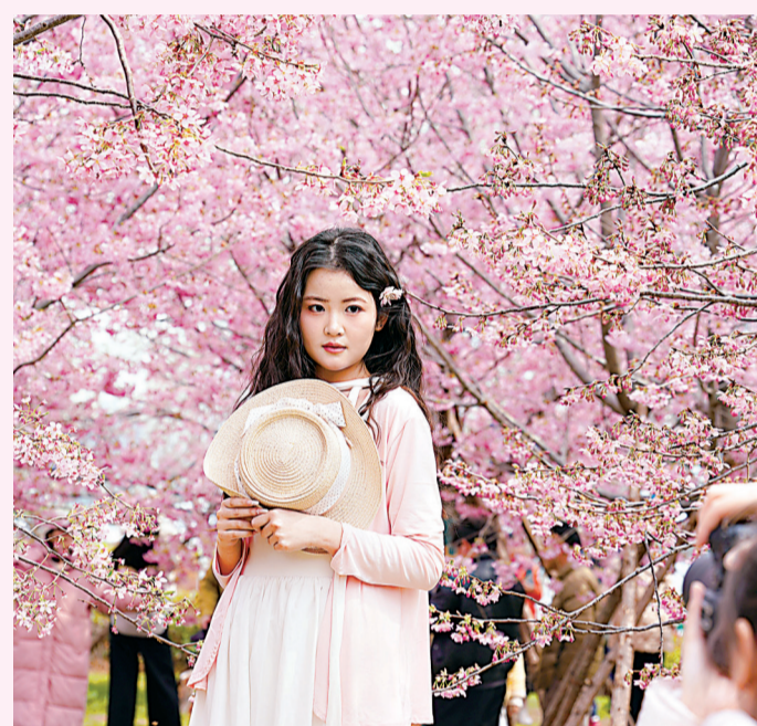
市民游客纷纷来到珞喻路景观廊赏花留影。