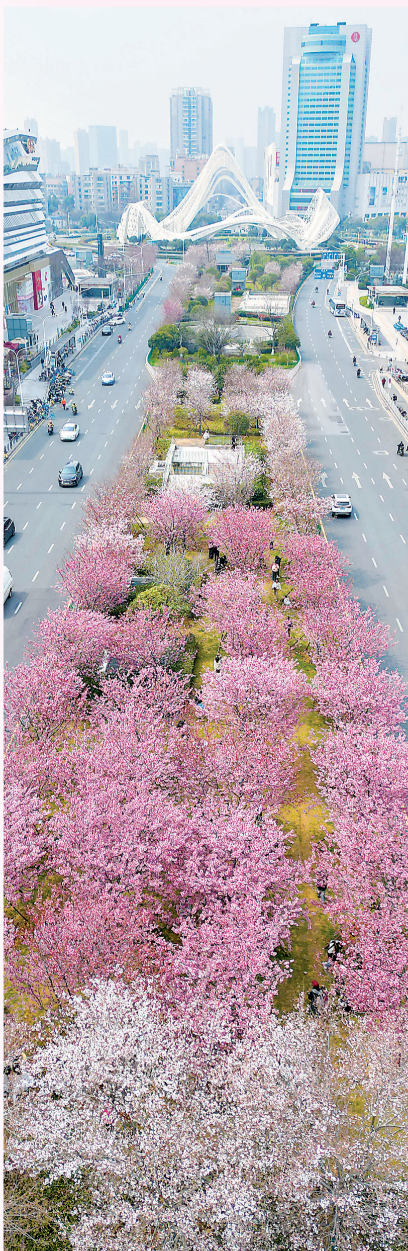
地铁2号线珞雄路站E出口外,珞喻路景观廊上的樱花开得正盛。