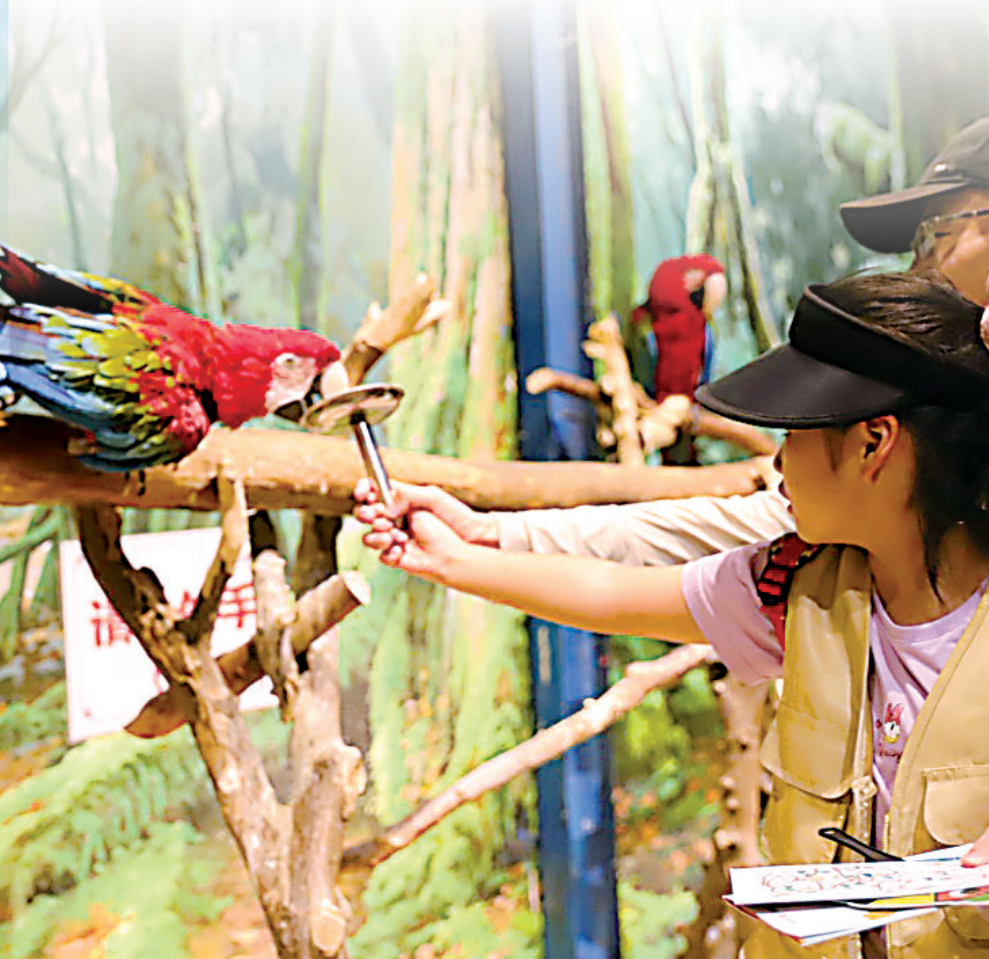
人文老师手把手引导孩子细致观察。