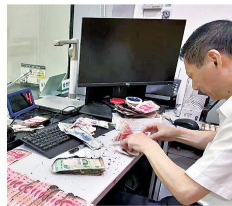
工行武汉新洲支行营业室为客户清点兑换火烧残钞。

工行依托人工智能、大数据等科技手段,创新构建“AI+大数据”智能风控模型,通过精准识别异常信号,准确预警潜在受害人,同时最大限度减少对客户正常使用的影响。工行武汉分行加强“警银协作”,有效管控高风险涉诈账户,自武汉市开展断卡行动以来,工行武汉分行在网银、自助终端、ATM等渠道,自动拦截可疑电信诈