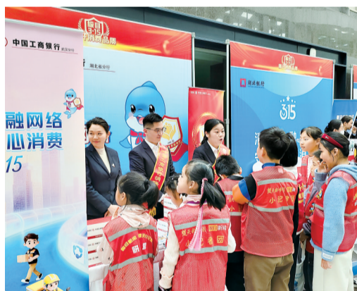
工行武汉分行围绕压岁钱等话题为小朋友普及金融知识。

在企业,聚焦职工需求普及金融权益、个人信息保护、反洗钱、防范非法集资等法律法规,提升风险防范知识,精准传递金融温度,让金融消保知识覆盖更多群体。