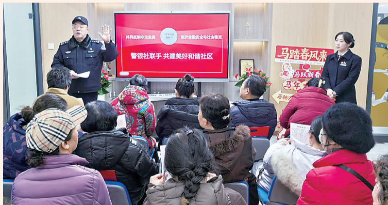
工行武汉百步亭支行银、警、社联合组织消保课堂进社区活动。

三月春风暖江城,金融消保正当时。中国工商银行武汉分行坚守国有大行初心使命,扛起金融消费者权益保护主体责任,以多元宣教筑牢风险防线,以暖心服务回应民生期盼,以专业智守护群众资金,奏响宣教有声、解忧有情、反诈有方的工行消保“三重奏”,将消保工作融入日常,为江城百姓的“钱袋子”撑起全方位守护的安全屏障,让工行温度温暖千家万户。