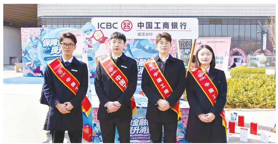
工行武汉水果湖支行走进商圈开展消保宣传。