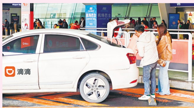
春运期间投入的天河机场T2航站楼网约车候车点为游客提供了便利。