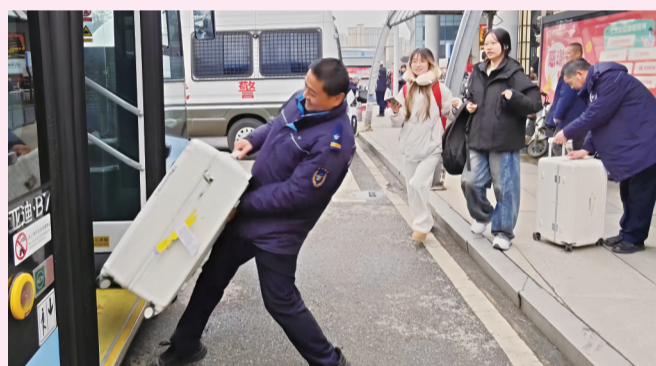
春运期间，武汉公交工作人员在武昌站接返校大学生。

交通运输执法部门深化“科技+协同”执法模式应用，实现对营运车辆的动态监管，让执法从“人海战术”向“精准施策”转变。通过大数据平台整合巡游车、网约车运营数据，对“四站一场”等重点区域的车辆运营情况进行实时监控，杜绝非法营运、不规范运营行为。