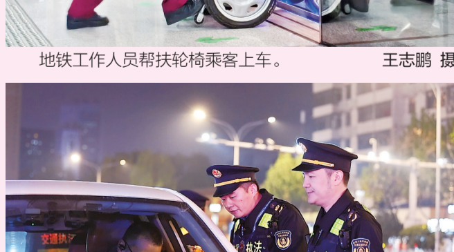
春运期间，执法队员在武汉站检查巡游出租车相关证件。冯安澜 摄