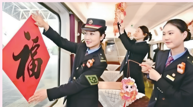
列车乘务员为车厢增添新年氛围。