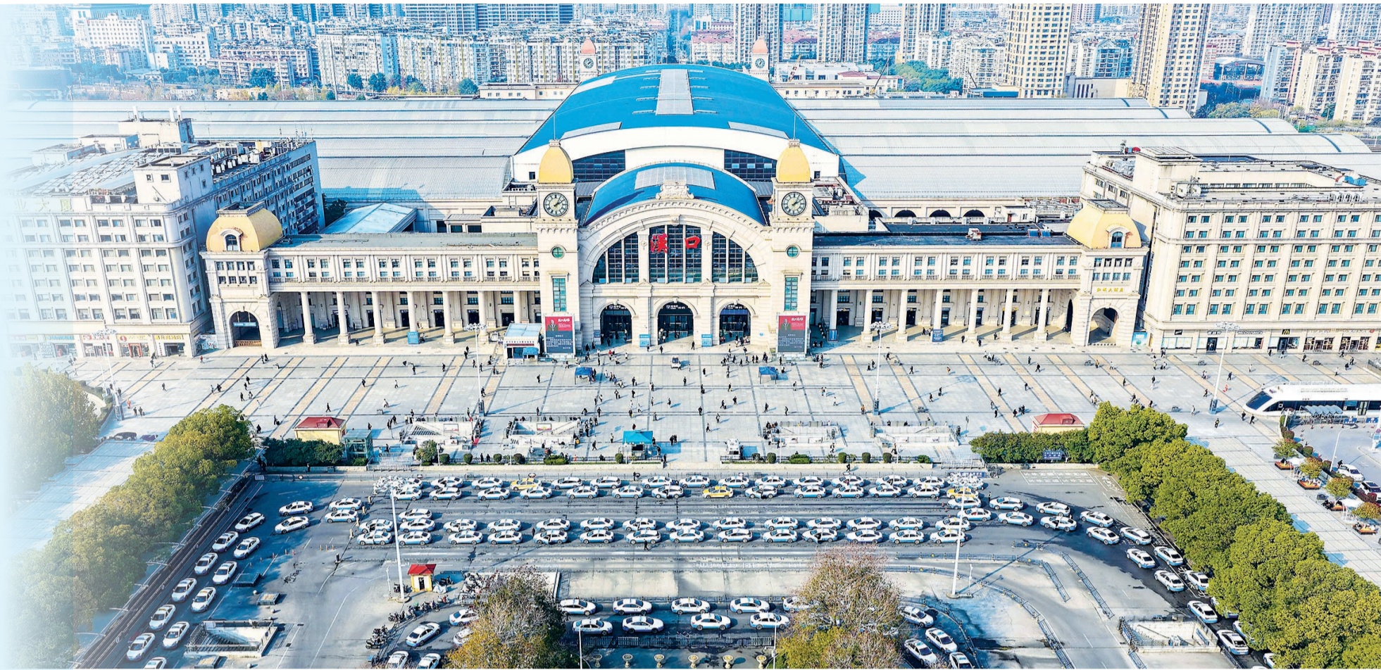
汉口站出租车排队接送乘客。

40天春运征程中，汉襄宜1小时高铁环线高效联动，天河机场空铁联运无缝衔接，数智化监管精准护航，暖心服务贯穿全程。2026年的春运，武汉释放出更具辐射力、融通力、保障力的枢纽能级，铺就了千万旅客平安归途，彰显出现代化大武汉的交通硬核实力与城市治理效能，国际性综合交通枢纽城市的名片愈发鲜亮。