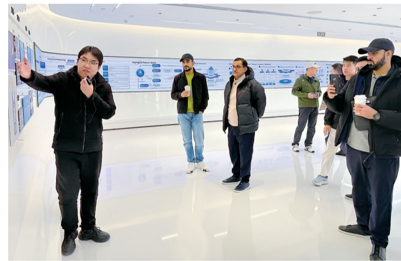
利楚商服接待外国客户。