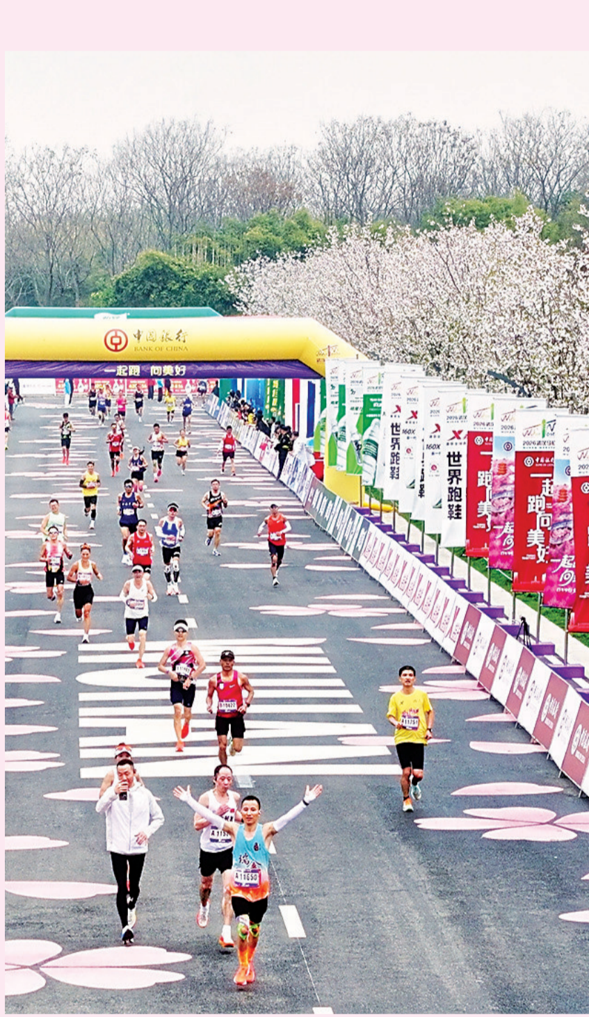
在青山江滩全马终点线，选手冲线欢呼。

（采写：长江日报记者赵萌萌 刘克翠 刘晨玮 史强 耿珊珊 樊友寒 陈其雄 郝天娇 秦璟 吴瞳 杨荣峰 统筹：陈勇）