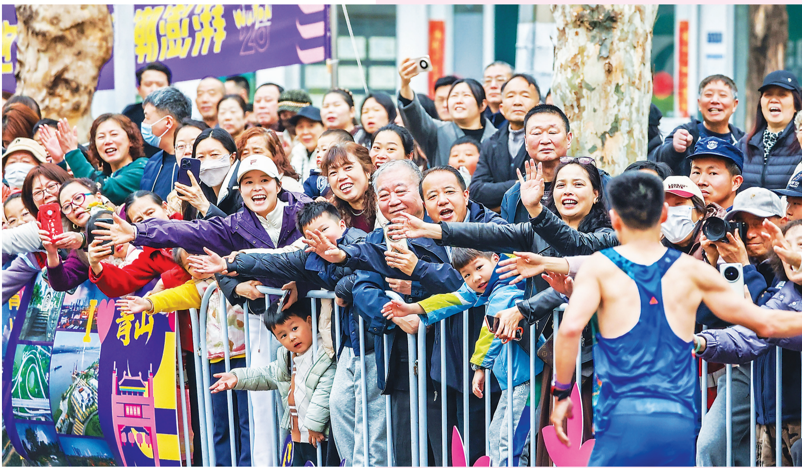
临近终点，市民为选手助威。