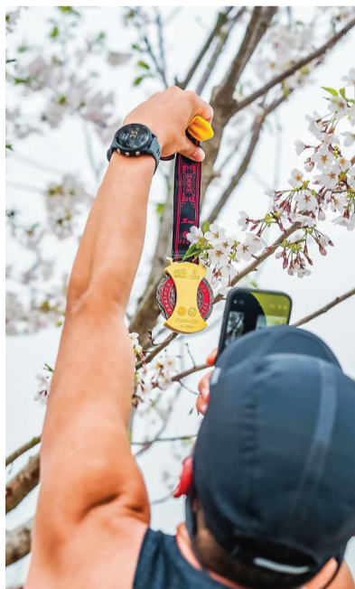
完赛选手举着完赛奖牌与樱花合影。