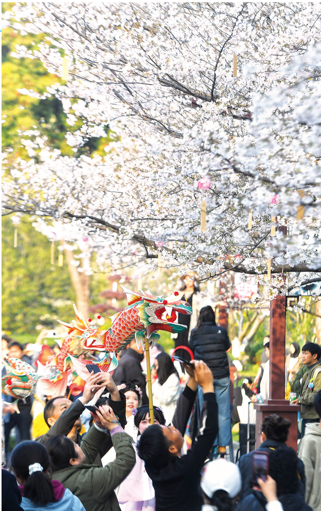
堤角公园游客赏樱花。