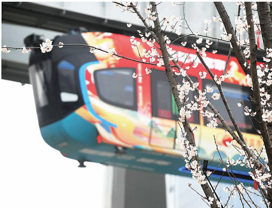
光谷中央生态大走廊樱花争艳,空轨穿梭其间。