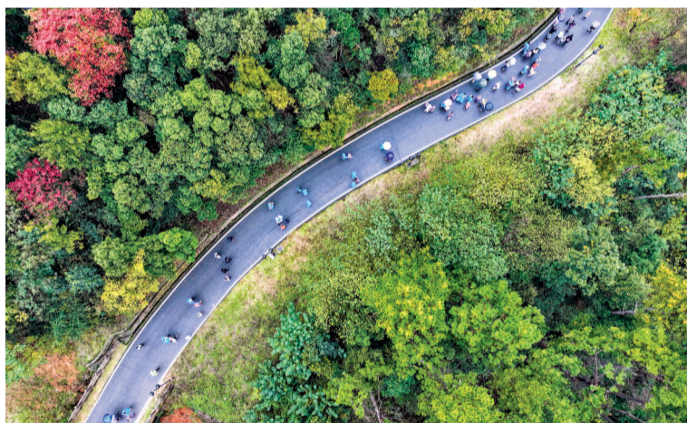
2025年中国城市户外运动挑战赛在江夏“三山”绿道举办。