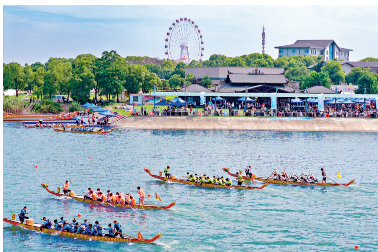
2025年，湖北省第十七届龙舟大赛在江夏梁子湖龙湾半岛景区举办。