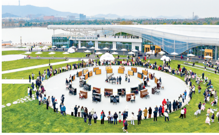
中央大公园“天空之城”上演音乐会。舒运平 摄

扬子江非遗文化馆里，可近距离感受武汉非遗的魅力。亲手制作青团、樱花饼等春日点心，参观传统民俗展示区，体验非遗技艺与手工技艺，让春日之旅更有文化的温度。 (长江日报江夏区首席记者杨晓雨)