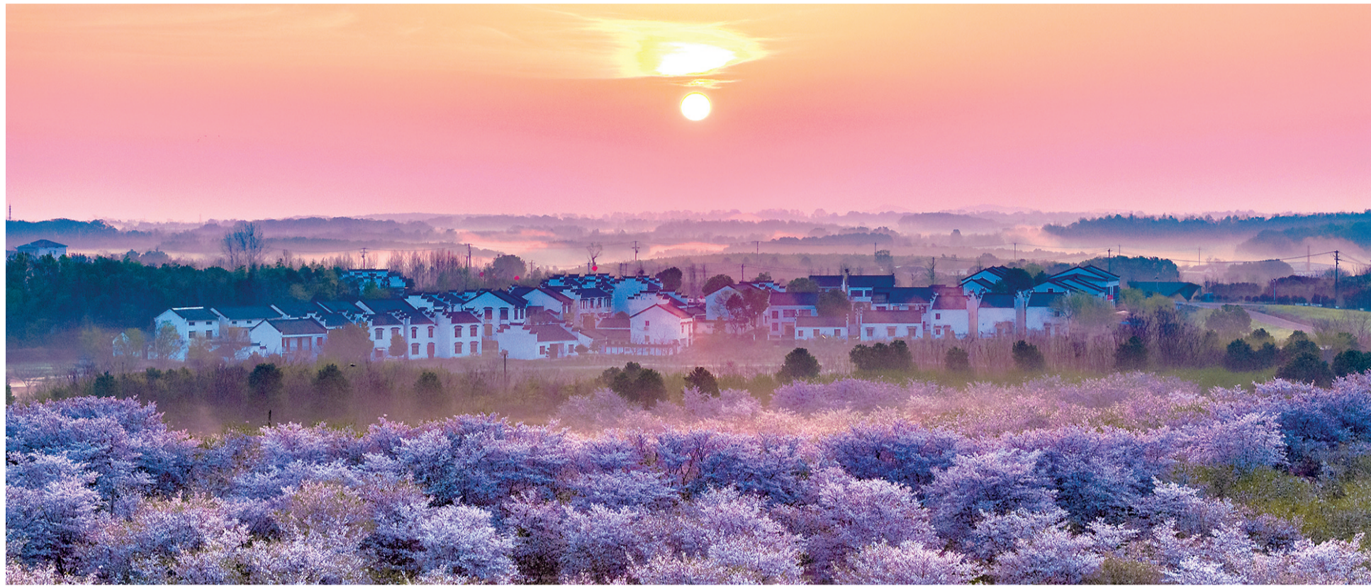
安山樱花园。

去，江夏的春天，正以另一种姿态静静铺开。这里有铺天盖地的金色油菜花，有藏在深山里的粉色秘境，有湖边落日与村咖的闲适，更有正在拔节生长的文旅新景。这个春天，跟着我走进江夏，把心交给三山三水。