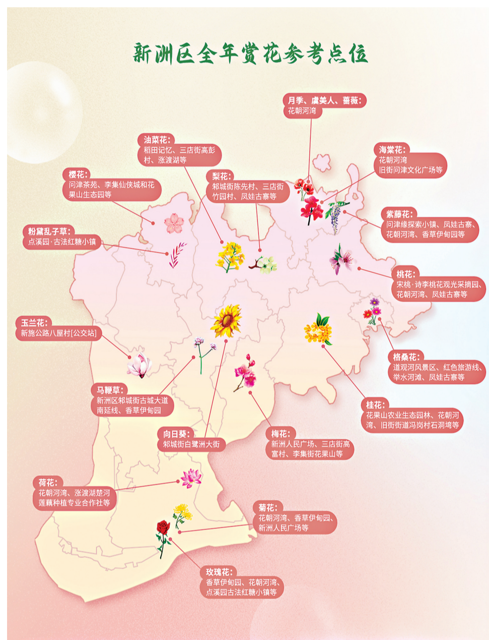
策划：新洲区文化和旅游局