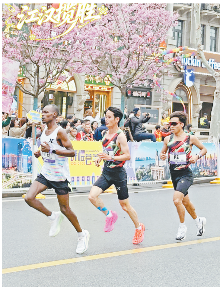
2026武汉马拉松赛上，选手途经江汉段，穿越花海，跑进春天。

我坐在街角的咖啡店外，看着来往的人。一个背着相机的年轻人在这里停下，拍了几张花下