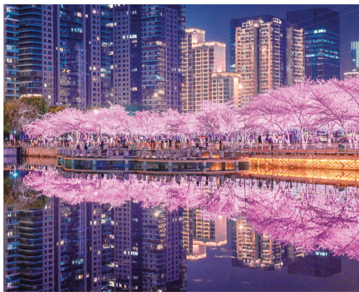
灯光勾勒出花的轮廓，湖水倒映着万家灯火。