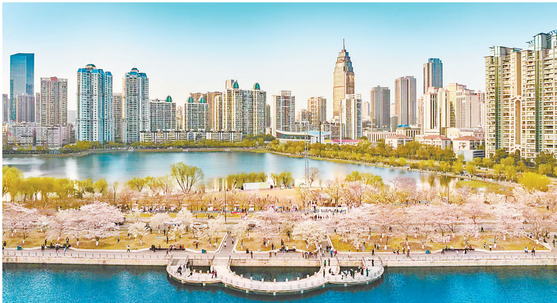
春日里，江汉区西北湖公园“樱花大道”繁花似锦，花与人共绘江城春日图景。