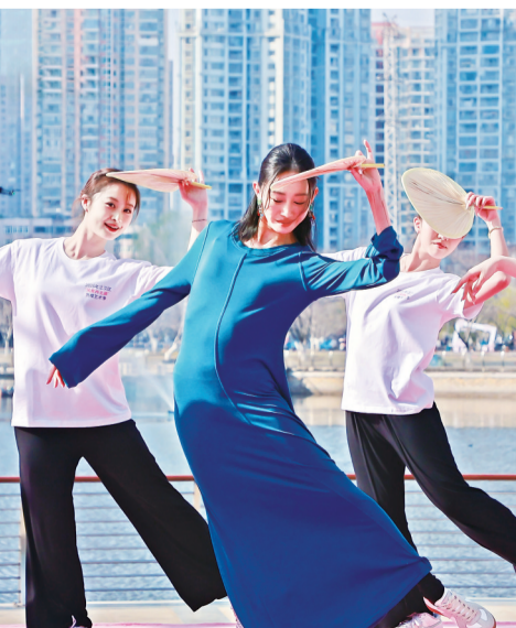
2026年江汉区赏樱艺术季启动仪式上，一级演员朱洁静(中)在西北湖畔翩翩起舞。