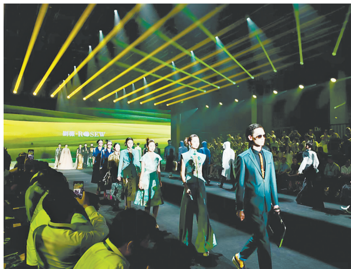
2025汉正街·武汉国际时装周。