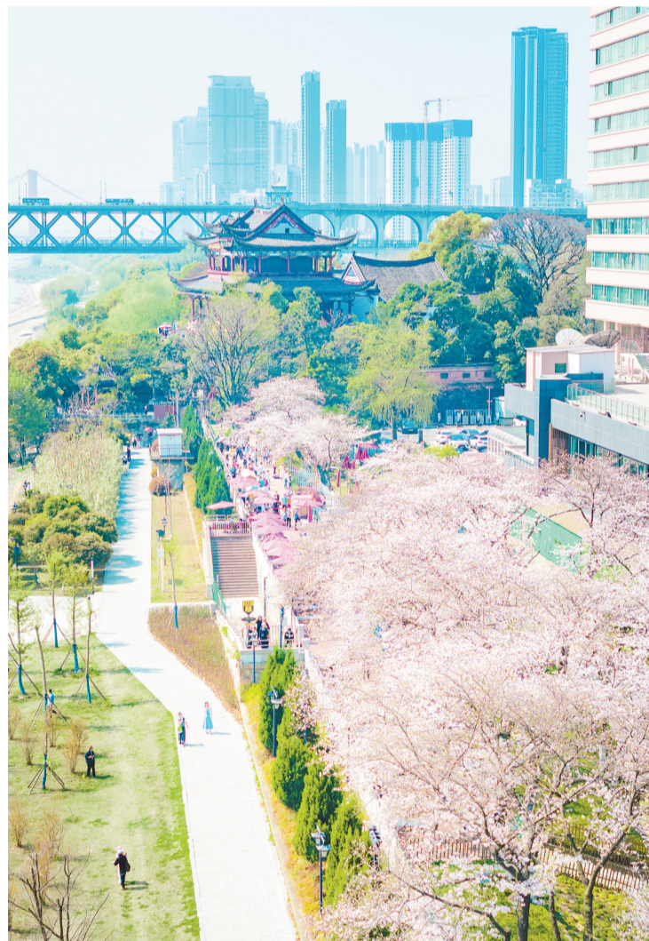
汉阳晴川假日酒店樱花如雪，成为游客打卡地。