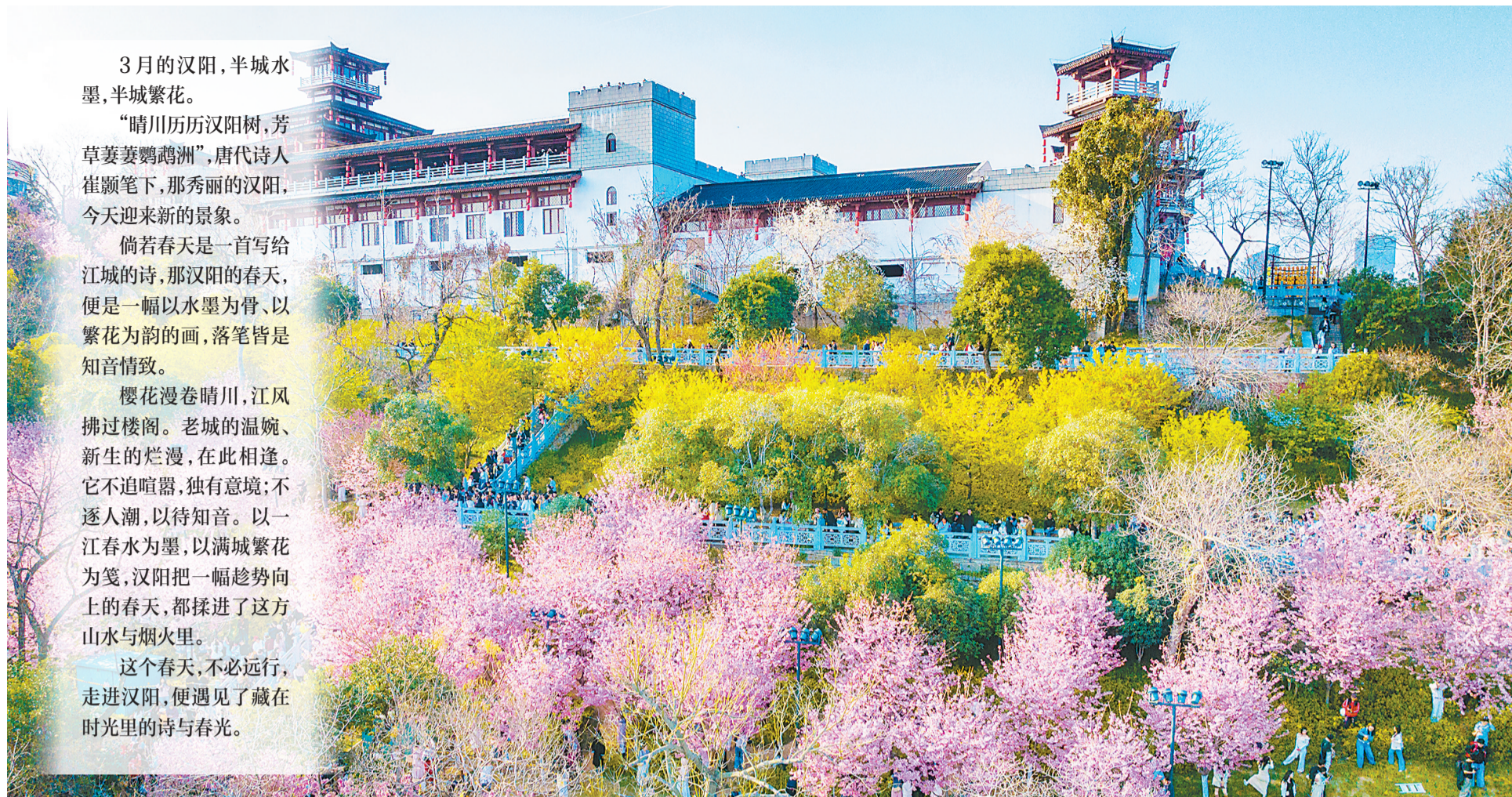
龟山粉红樱花绽放，与山顶知音殿相映成趣。